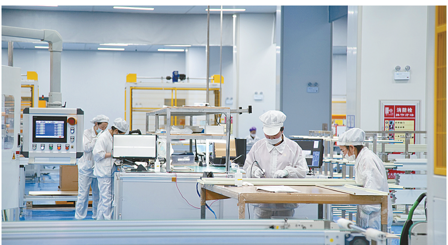
3月10日，江苏悦阳光伏科技有限公司生产车间内，工人正在加紧生产。据了解，该公司11条生产线满负荷运作，订单已经排到下半年，预计今年总体产能7GW，可实现年产值60亿元以上。

从黄海之滨到堤西水乡，眼下的东台大地战鼓阵阵、热浪滚滚，各地一着不让抢抓政策机遇期、发展黄金季，比学赶超大干快上拼经济，争先创优善作善成开新局，奋力奏响高质量发展最强音。