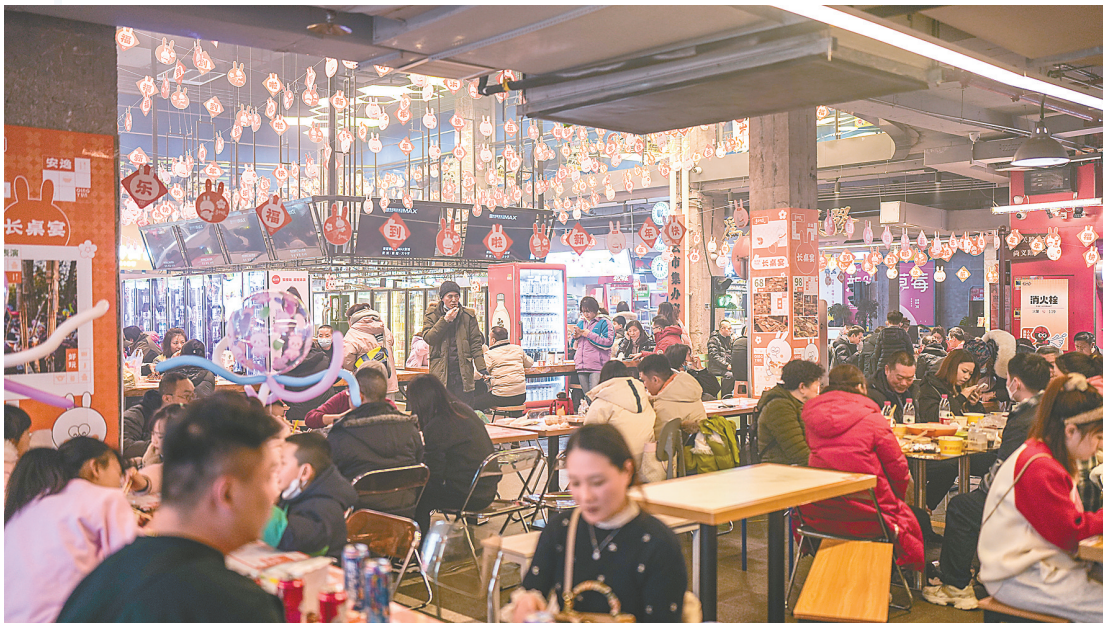
消费者在贵阳市南明区“青云市集”品尝特色美食(1月23日摄)。

消费驱动力还来自高质量发展引领的增量创新。中国消费市场正进入消费升级、模式创新的快车道,政府接连出台政策增强消费能力,改善消费条件,创新消费场景,使消费潜力得以充分释放,住房改善、新能源汽车、养老服务、教育医疗文化体育服务等新消费需求不断涌现,为消费市场转暖注入可持续动力。德勤消费者调研报告显示,“拥抱多元创新”“追逐技术跃升”成为中国消费市场新趋势。麦肯锡2023中国消费者报告指出,中产阶级继续壮大、高端化势头延续等趋势正在重塑中国消费市场。