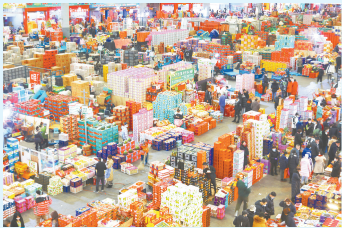
消费者在浙江义乌果品市场采购年货(1月17日摄)。