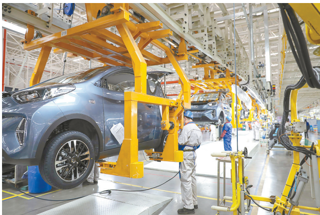
2月3日,工人在位于安徽省芜湖市的奇瑞汽车股份有限公司新能源二期工厂总装车间作业。