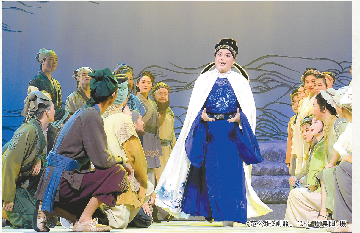
《范公堤》剧照。记者 周晨阳 摄