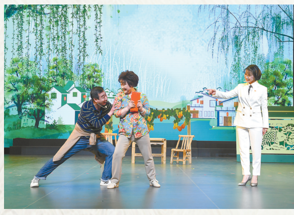
滨海县东坎街道文化站送戏进城。

春节期间,盐城市文化馆群星剧场内张灯结彩、丝弦缭绕,来自滨海县东坎街道文化站的“美丽乡村·东坎有戏——喜庆2022年新春文艺演出”在这里举行。饱含着浓郁乡土气息的节目,让现场观众耳目一新、倍感亲切。当天的演出,仅线上观众就有近7万人次。