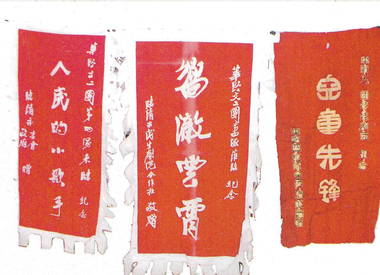
部队和单位赠予“娃娃剧团”的锦旗。