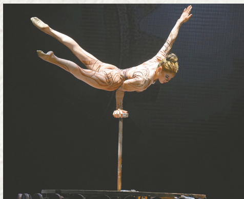
省杂技团作品《炼——倒立技巧》。