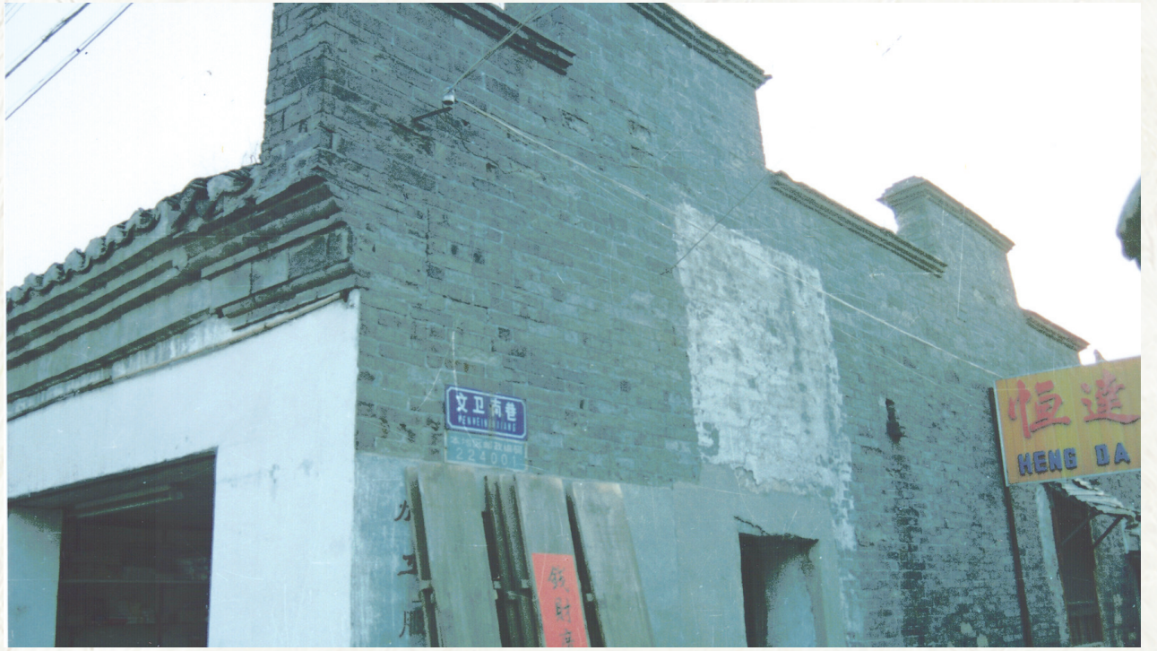
江淮银行旧址(资料图)

“革命战争年代,新四军不仅在敌后与日伪军浴血奋战,还先后创办江淮银行和盐阜银行,发行货币、繁荣经济,与敌人展开激烈的货币战、经济战。”2021年6月,中央广播电视总台、中国人民银行联合策划的大型融媒体报道“红色金融路”走进盐城,寻访红色货币里的精神密码,引领广大党员群众通过镜头穿越时光隧道,走进烽火连天的革命年代,重温党的光辉历程,感悟党的初心使命。