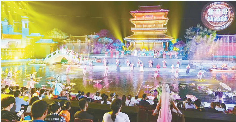
东台西溪景区大型演出