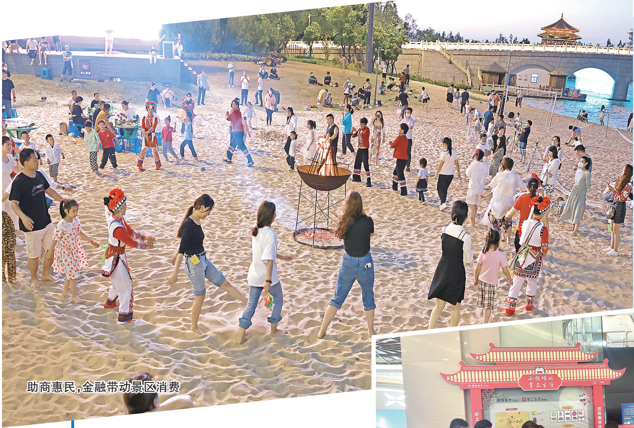
助商惠民,金融带动景区消费