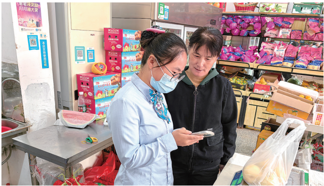
农业银行盐城分行工作人员走进水果店介绍优惠活动