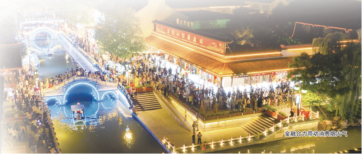
金融合力带动消费烟火气

南京银行盐城分行与市文化旅游投资发展有限公司、安徒生童话乐园景区合作,推出信用卡新客户可1元购盐城旅游年卡、1元购安徒生童话乐园电子券活动。与食品商户合作,开展信用卡1元购100元充值卡活动;与加油站合作,开展加油满100元立减30元活动;与连锁洗衣店合作,开展信用卡1元购200元洗衣卡活动。