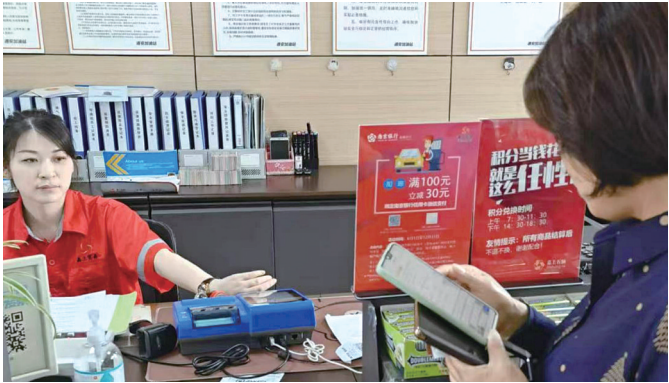
南京银行盐城分行工作人员向客户介绍消费节活动