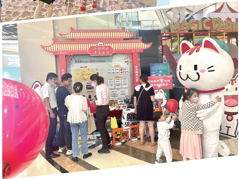
招商银行盐城分行在大有境商圈开展消费节活动宣传