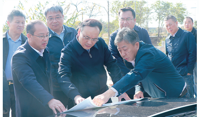
市交通运输局主要领导调研公路建设

近年来,盐城市公路事业发展中心以交通强国建设为统领,以高质量发展为导向,在市交通运输局党委正确领导下,以争创交通运输现代化示范区为抓手,以建设人民满意交通为目的,坚持稳字当头、稳中求进,服务大局、服务人民、服务基层,加快构建安全、便捷、高效、绿色、经济的现代综合交通体系,在勇当沿海地区高质量发展排头兵、谱写“强富美高”新盐城现代化建设新篇章中争当表率、争做示范、走在前列,奋力书写公路现代化高质量发展答卷。