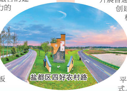
盐都区四好农村路

东台市旅游公路1号线、射阳县海堤路、阜宁县马家荡旅游公路入选全省“美丽农村路”样板路,盐都区大陈线、亭湖区兴洋线、阜宁县204国道复线、大丰区麋鹿复线入选全省“平安放心路”样板路。