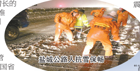
盐城公路人抗雪保畅

路漫漫其修远兮,盐城公路人将砥砺前行,全力巩固和发展好建设成果,不断放大“公路现代化建设”示范效应,写好“创新篇”,下好“改革棋”,争当“实干家”,交出“富民卷”,谱写好盐城公路交通现代化建设新篇章。