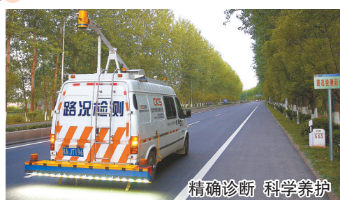
精确诊断 科学养护

“三分建,七分养”。公路的良好通行,不仅靠过硬的公路建设底子,更靠科学的公路养护管理。盐城公路部门立足养护工作实际,锐意推动科技兴路,“以机器换人力,以技术提效率”,积极引进各类智能化设备参与试点,通过自动化巡查获取海量路况数据,主动聚焦公路基础数据的深度挖掘应用,不断提高公路养护的科学化决策力和专业化管理水平,为数字驱动型养护现代化提供有力支撑。