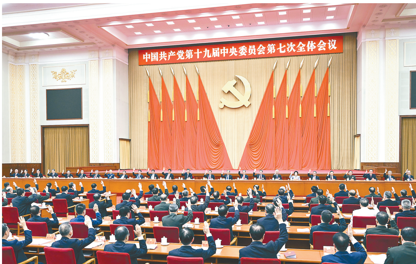
中国共产党第十九届中央委员会第七次全体会议，于2022年10月9日至12日在北京举行。中央政治局主持会议。

新华社北京10月12日电 中国共产党第十九届中央委员会第七次全体会议公报(2022年10月12日中国共产党第十九届中央委员会第七次全体会议通过)中国共产党第十九届中央委员会第七次全体会议，于2022年10月9日至12日在北京举行。出席全会的有中央委员199人，候补中央委员159人。中央纪律检查委员会委员和有关负责同志列席会议。全会由中央政治局主持。中央委员会总书记