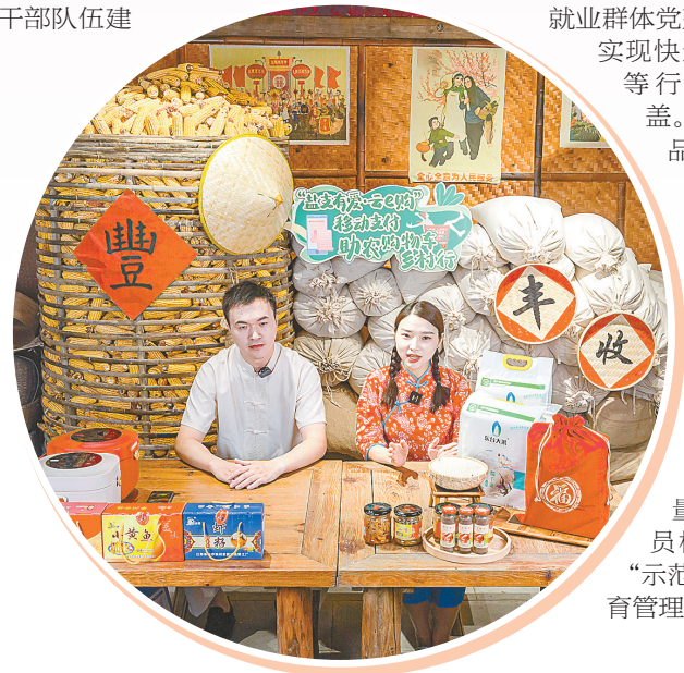
▲紧扣乡村新业态新模式,扎实开展党建引领“快递进村、产品出村”行动,选择100个村进行网红直播试点,今年以来,已举办网络直播3000余场次,实现线上销售额7000多万元,带动3万多农户增收致富。

设的思考研究,相关成果被中组部《党建研究》刊载。常态化推动县镇村三级干部“村村到、户户进、人人访”,打通联系服务群众“最后一米”。推广“支部+合作社+电商物流”模式,加快建设网红直播村,让手机成为新“农具”、直播成为新“农活”,今年以来,实现线上销售额7000多万元,带动3万多农户增收致富。完善“两新”工委运行机制,抓实新业态新就业群体党建试点,在全省率先实现快递、外卖、交通运输等行业党委市县全覆盖。培树“盐小哥”党建品牌,党员小哥带头组建先锋服务队,积极参与隐患排查、社情民意收集等志愿服务活动,同步建立党员“先锋指数”和积分奖励机制,让奔跑在“路上”、活跃在“网上”的治理对象化身治理力量。出台《盐城市党员档案管理办法》,以“示范+规范”推动党员教育管理走深走实。