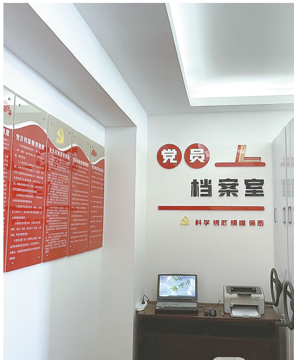
▲全面推进党员档案规范化标准化建设,制定党员档案管理办法,建立内容、整理、保管、查阅、转递、保障等6项制度,细化37项操作办法,对建档、整档、存档各环节进行规范。