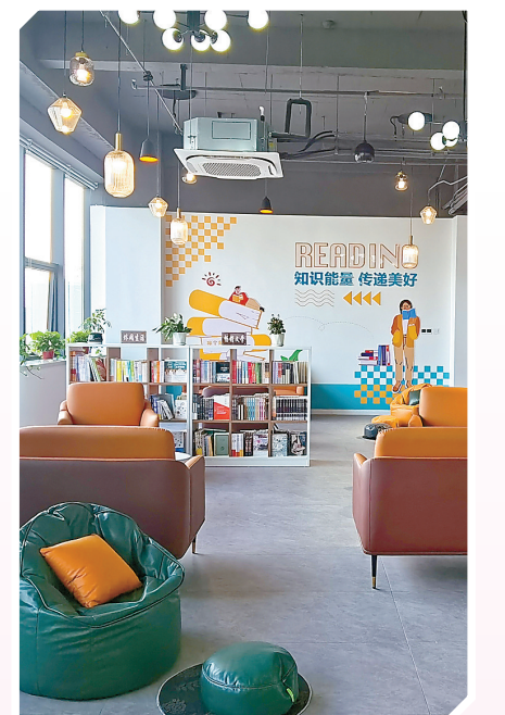
►实施人才公寓提升工程,聚焦青年人才生活习惯,秉持“家”理念,不断完善公寓内部书吧、超市、健身房、无人售货机等生活配套设施,为青年人才施展才华、建功立业构筑温馨舒适、青春时尚的居住环境。

设,突出需求导向,着眼青春时尚,着力构建更具品质、更有品位的青年人才社区,持续打响“乐居盐城”人才服务品牌。