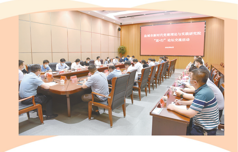
▲成立盐城市新时代党建理论与实践研究院,着眼研讨交流常态化、研究成果实用化,邀请部分高校专家教授举办“思·行”论坛交流活动,共探问题根源,共商解决对策。

▲举办全市行政干部公共管理能力、国企干部经营管理能力两个强化班,持续推动党员干部政治能力、专业能力“双提升”。