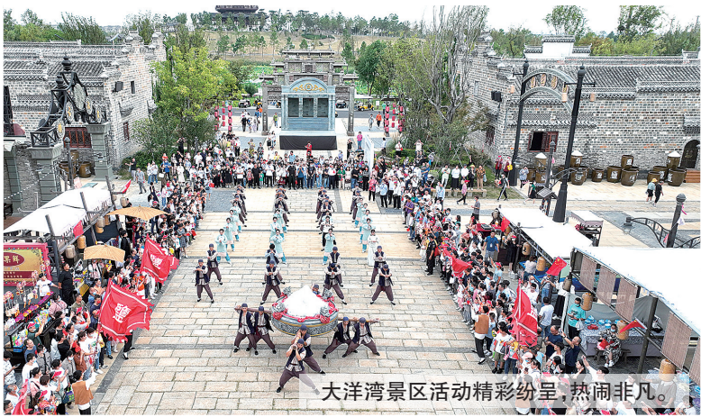
大洋湾景区活动精彩纷呈，热闹非凡。