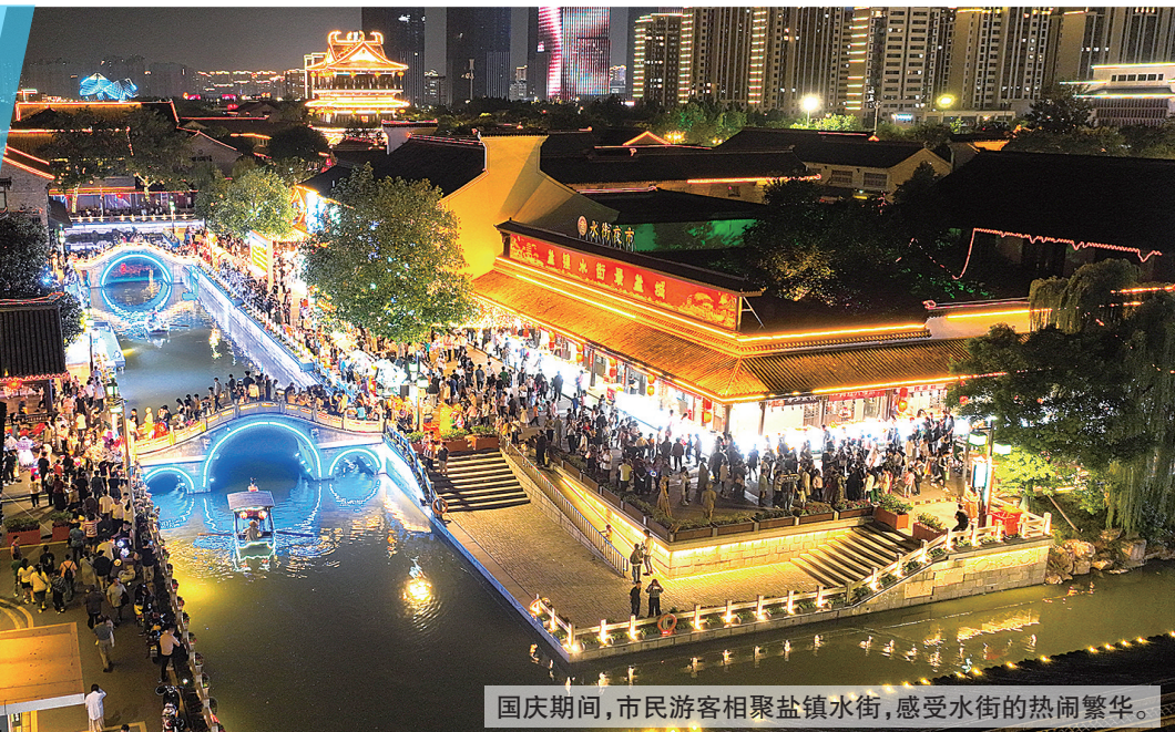
国庆期间，市民游客相聚盐镇水街，感受水街的热闹繁华。

乐享假期 同庆国庆 抒发家国情怀，国风国潮成就别样精彩，生态画卷让人向往之……这个国庆假期，全市各地都安排了丰富多彩的活动，铺展一幅幅欢乐祥和的美好画卷。人们纷纷走出家门，看表演、赏美景、品美食，体验传统文化，乐享美好幸福时光。