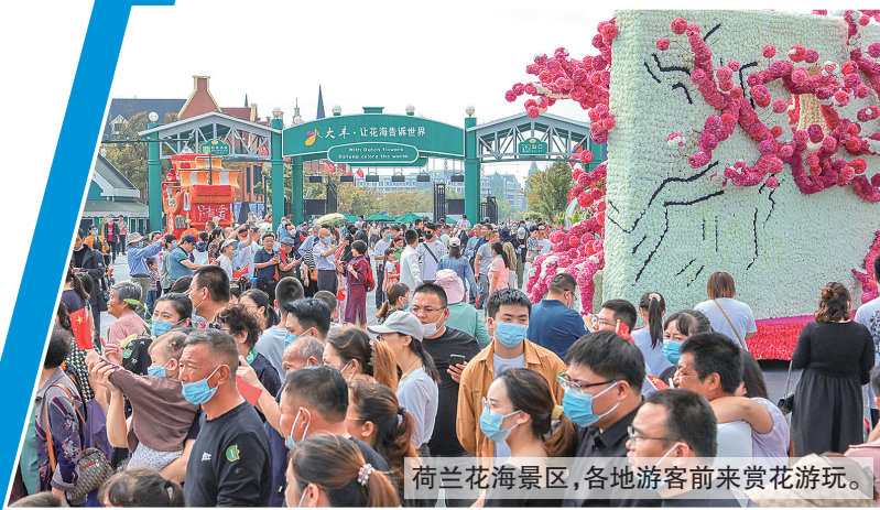
荷兰花海景区，各地游客前来赏花游玩。