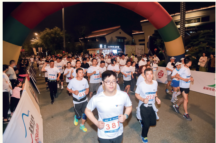
荧光夜跑,我运动,我精彩。