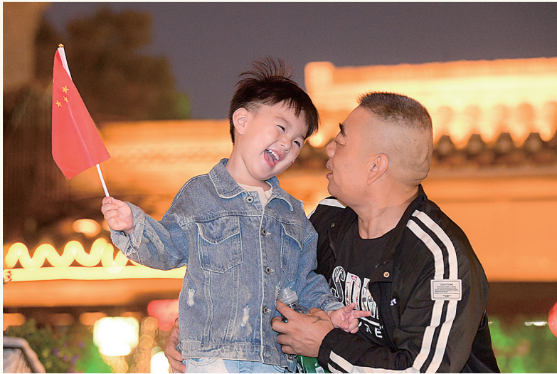
节日里的盐镇水街,处处欢声笑语。