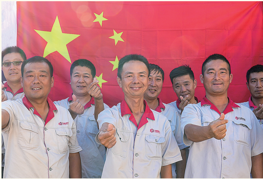
社会各界组织“我和国旗合个影”活动,为祖国73岁生日送上深深祝福。