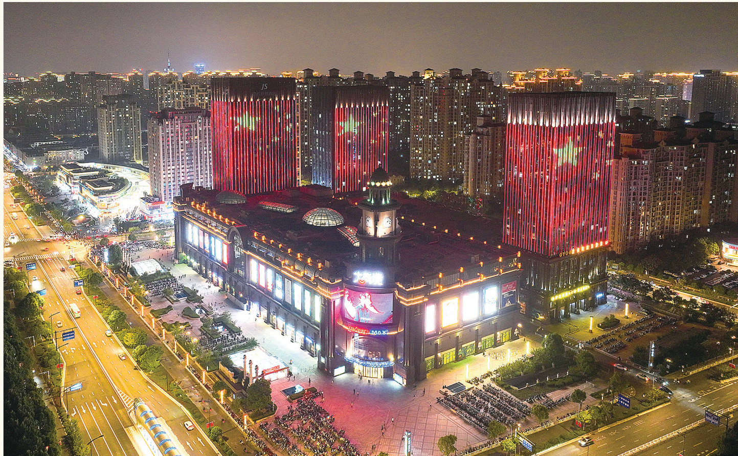
我市夜景亮化设施开启节日模式,街区流光溢彩,营造了喜庆的氛围。