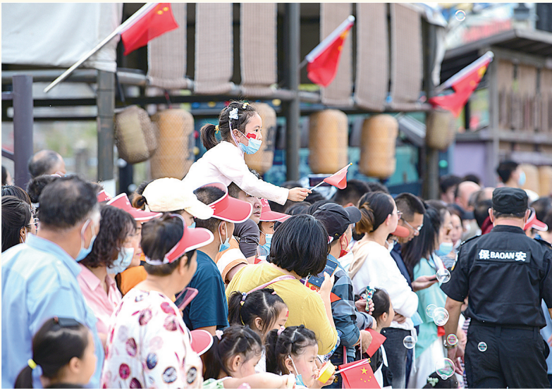
大洋湾景区热闹非凡。