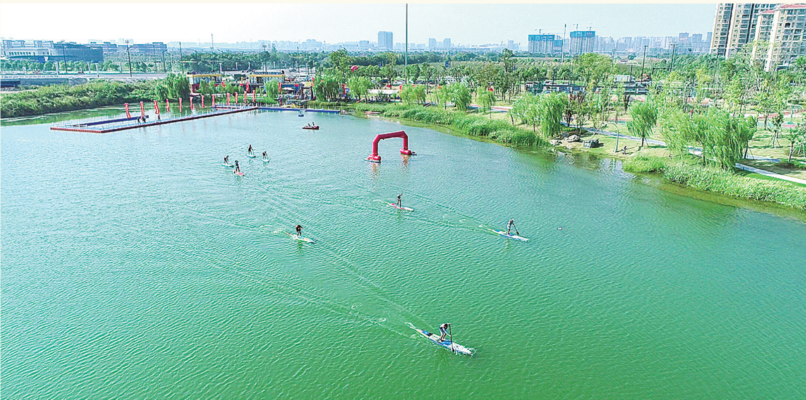
中华海公园桨板邀请赛成功举办。