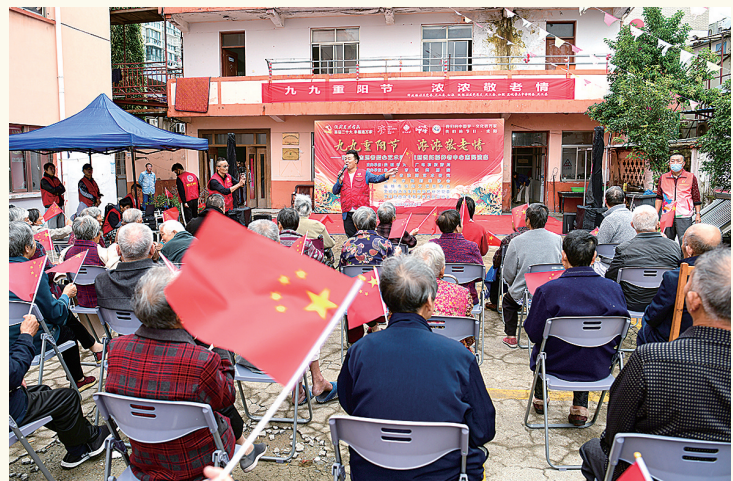
10月4日上午,市文化志愿者爱心艺术团走进慈悦托福养老中心,为老人们献上了精彩纷呈的文艺演出。老人与志愿者们齐声合唱,摇动手中的小国旗,现场欢歌笑语,一片欢腾。