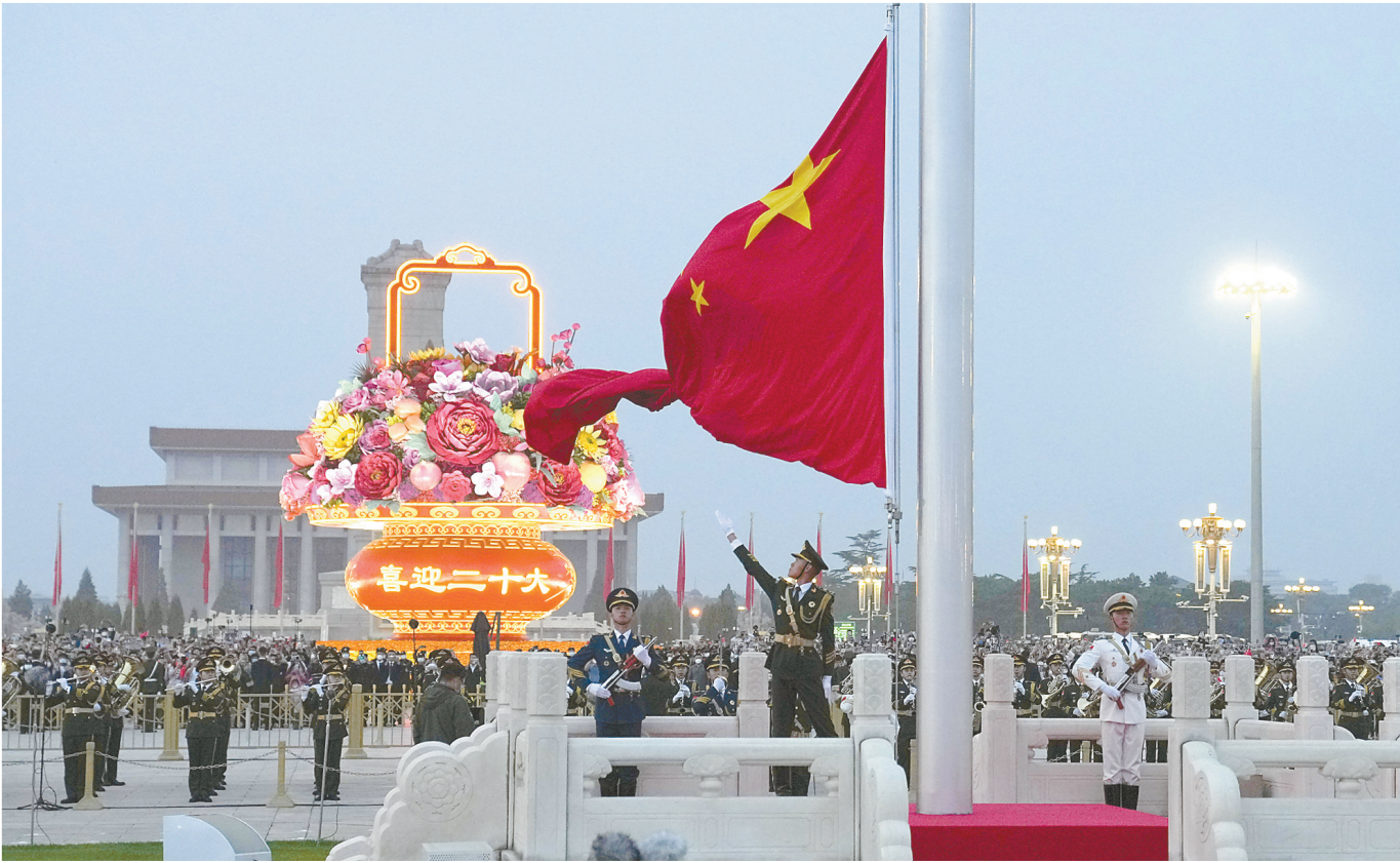
10月1日清晨,隆重的升旗仪式在北京天安门广场举行,庆祝中华人民共和国成立73周年。