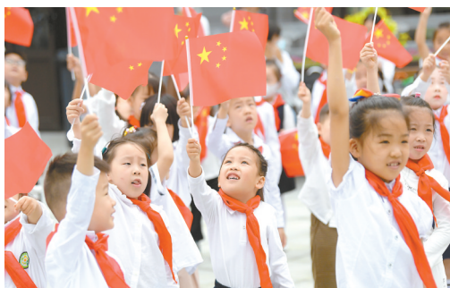
10月1日，盐城市博物馆以“我和我的祖国”为主题，开展系列文化活动。

城市更新是城市发展的必然选择和永恒主题。盐城交投集团负责人表示，把此次获奖作为前行的号角，围绕“双碳”目标，坚持绿色低碳发展道路，继续大力推进城市更新试点项目建设，优化项目组织协调、加强空间整合和时序衔接、倡导“共建、共治、共享”的理念，进一步提升完善湿地博物馆、会议中心及酒店的各项功能，努力探索城市更新工作机制、实施模式、政策措施等方法路径，力争形成可复制、可推广、可持续的经验模式，为完善城市功能、优化产业结构、改善人居环境、促进经济社会可持续发展作出积极贡献。