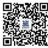
盐城发布微信二维码