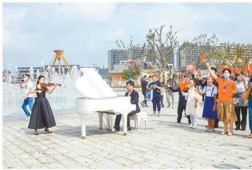
10月1日，盐城经济技术开发区KK-PARK国际街区正式开街。