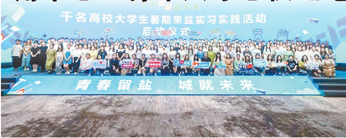
实施“黄海明珠人才计划”，开展“青春留盐 城就未来”活动（市人才办提供）

人才资源是最稀缺、最宝贵的资源，人才竞争决定未来城市发展格局。近年来，市委、市政府高度重视青年人才工作，深入践行人才优先发展战略，以加快推进新时代人才强市建设为统领，以实施“黄海明珠人才计划”为抓手，深化推进名校优生“汇盐行动”、万名学子“聚盐行动”、驻盐学子“留盐行动”，大力推进人才公寓提升工程，聚力打造城市青年人才社区，全方位培养引进用好各类青年才俊，为“竞逐新赛道 勇当排头兵”汇聚强劲青春动能。