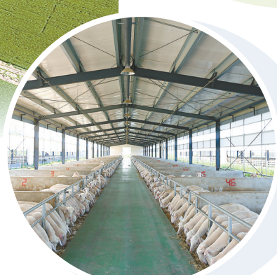
江苏乾宝牧业有限公司标准化羊舍内景