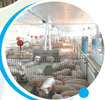
江苏鹏达牧业有限公司标准化生猪养殖场