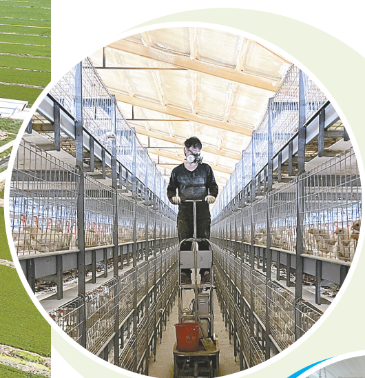
滨海瑞祥家禽养殖有限公司肉鸡养殖巡检