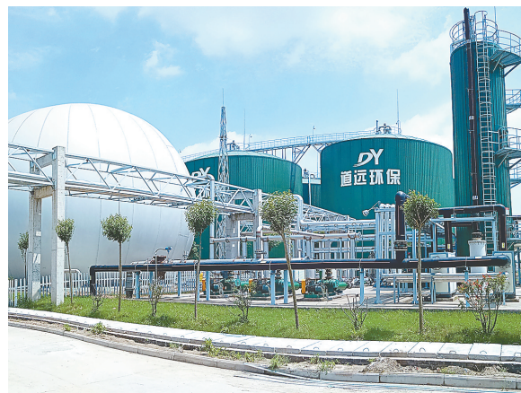
江苏道远节能环保科技有限公司大型沼气工程集中处理畜禽粪污

农业的绿色发展与人民福祉紧紧相连。推进农业绿色发展是农业发展的观的一场深刻革命,也是农业供给侧结构性改革的主攻方向。我市畜牧业坚持“保供给、保安全、保生态”的目标不动摇,在肩负肉食品保供任务的同时,切实加强畜禽粪污资源化利用工作,积极构建种养结合、农牧循环、综合利用、绿色发展的新格局。