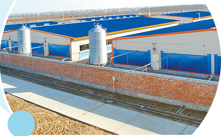
中粮家佳康(江苏)有限公司养殖场外景

为解决原有畜禽粪污处理设施设备运行能力不足、粪污消纳不及时、处理水平低、种养脱节等粪污处理利用难题,响水在全县每个规模养殖场推广安装干湿分离机、气浮机,建设黑膜发酵池、风机除臭系统等,并通过公司化流转规模养殖场周边基本农田作为消纳主体,目前已在县内规模畜禽养殖场中形成了一个“可以容纳、随时清理、就近还田、利用率高”的畜禽粪污处理模式。