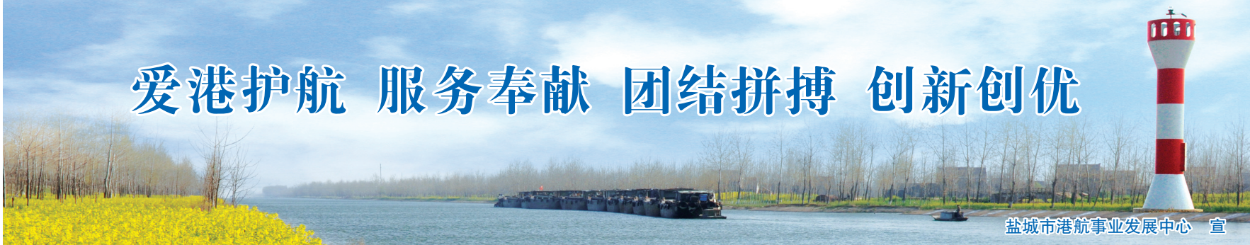
盐城市港航事业发展中心 宣