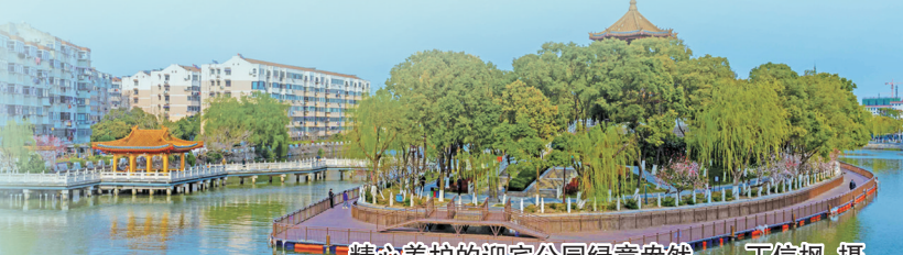
精心养护的迎宾公园绿意盎然

郑文霞表示,该处通过开展系列主题教育,组织党员干部接受党史学习教育,进一步感受革命先辈的爱国主义精神和为国为民的革命情怀,使党员干部做到学史明理、学史增信、学史崇德、学史力行,激励每一位党员干部紧紧围绕“勇当沿海地区高质量发展排头兵”目标定位,更好地履职尽责,为我市园林绿化事业作出更多更大的贡献,以实际行动迎接党的二十大胜利召开。