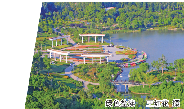
绿色盐渎