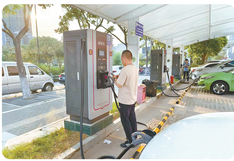
用“我的盐城”APP直接扫码支付,广大新能源车主充电更方便了。

本报讯(倪亚佳 周华皓)“现在不管是哪家公司建的充电桩,直接用‘我的盐城’APP就能直接扫码支付充电了,真是太方便了!”9月6日,正在盐城凤鸣缙香停车场充电站扫码支付的用户夏先生说。