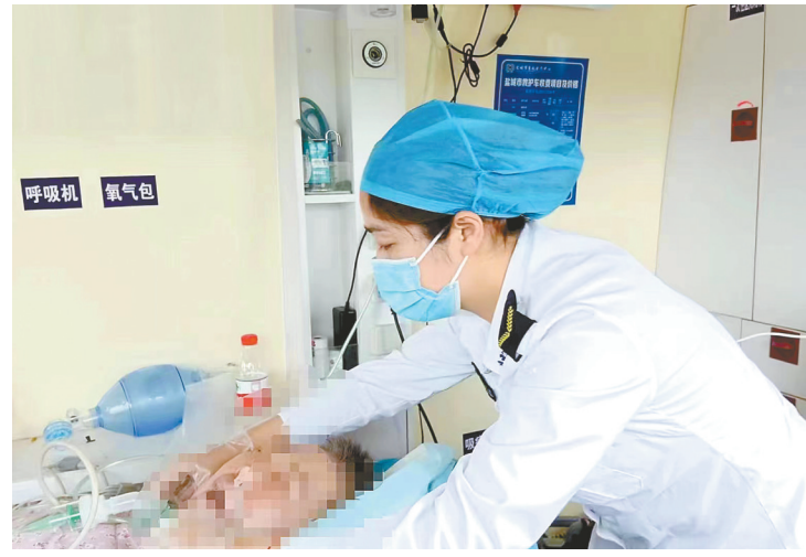
急救转运

近年来,市急救医疗中心全面提升院前综合救治能力,并申请创建“美国心脏协会(AHA)心血管急救培训基地”。去年12月,该中心被“美国心脏协会(AHA)心血管急救培训中心”正式授牌,这标志着盐城120心血管急救与培训能力得到国际权威组织认可,并于今年1月20日“120急救宣传日”当天正式揭牌。