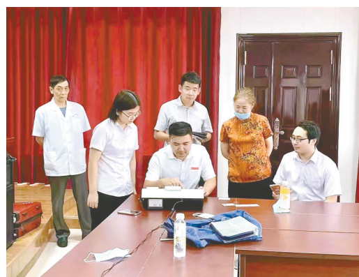
提供暖心金融服务

今年以来,面对错综复杂的经济形势和异常严峻的疫情状况,华夏银行盐城分行紧紧围绕盐城市委、市政府和监管部门的工作部署,严格执行扎实稳住经济一揽子政策措施,积极推动各项金融工作,全力服务地方经济发展。为积极支持企业战胜疫情渡过难关,华夏银行盐城分行牢记国企责任和担当,精准发力,帮助普惠小微企业纾困解难,提升服务质效,努力做到统筹疫情防控和金融服务保障“两手抓、两手硬、两不误”。