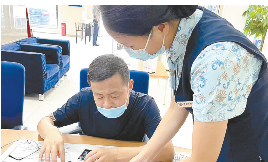
厅堂员工向客户宣传金融惠企惠民纾困政策