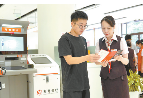
认真解答客户咨询

为落实好中央、省、市关于统筹疫情防控和经济社会发展决策部署，招商银行盐城分行积极响应政府号召，将疫情防控、金融保障和支持实体经济作为头等大事来抓，结合普惠金融支持政策，聚焦重点领域、薄弱环节，持续加大对实体经济的金融支持，切实帮助中小微企业解难题、渡难关，与企业同心相守、共克时艰。