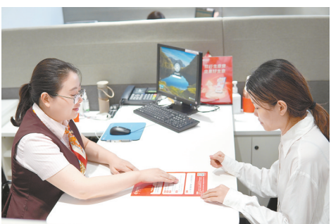
提供优质金融服务