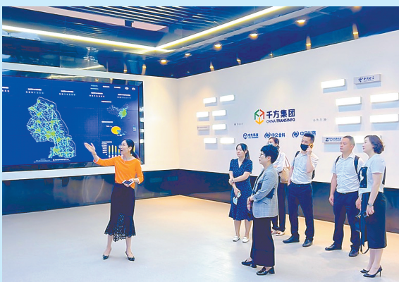
了解相关企业发展规划