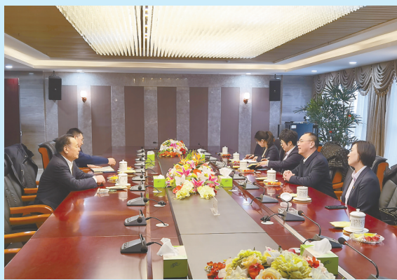
座谈交流企业金融需求