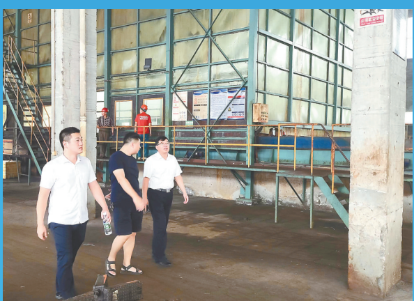
调研企业生产经营情况