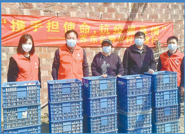
助企抗“疫”共渡难关

做优流程,提升服务实体的质效。该行以全国运营大集中、新信贷核心系统上线为契机,优化整合资源,去繁就简,打造全流程银行,进一步提升客户满意度。一方面,该行抽调全市业务骨干,组建业务营销小组,集中推进项目攻关,同时下发业务营销日志模板,详细记录从营销到贷后管理各环节中的关注要点,进一步提升办贷效率;另一方面,该行充分发挥金融科技力量,引导客户通过农发企业银行App、银企直连等系统,预约办理开户、网银签约等业务,减少客户等待时间,提高业务办理效率,让客户业务办理更方便、更快捷。