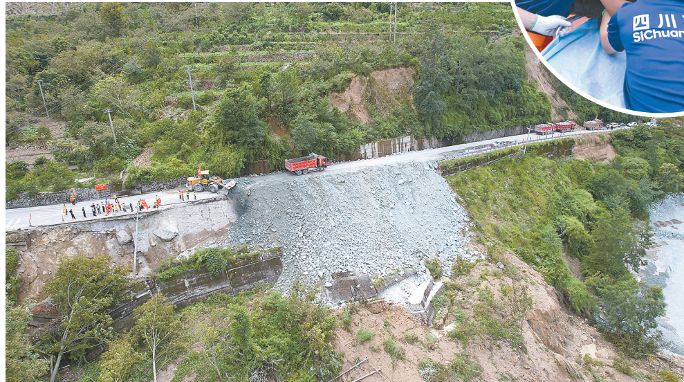
9月6日,救援人员在抢修泸定县城与磨西镇之间的公路(无人机照片)。