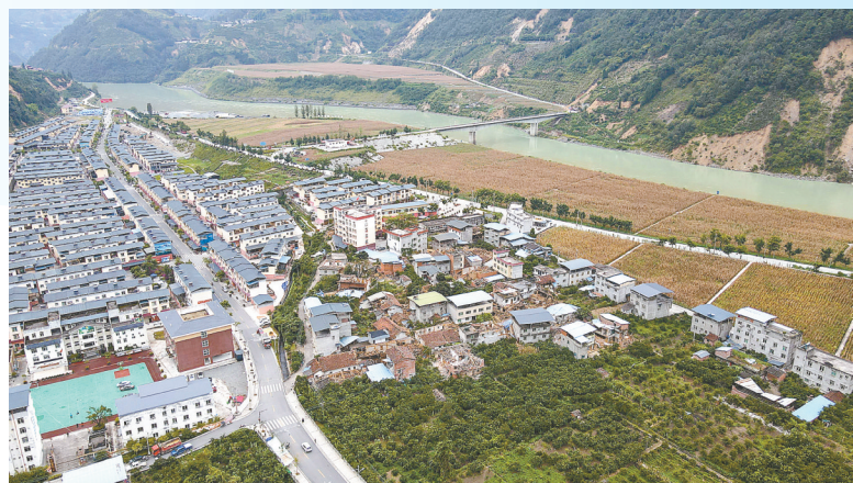
▲ 这张拍摄于9月6日的照片显示石棉县山岗坪乡部分老旧房屋倒塌(无人机照片)。

据悉,四川正在全力以赴搜救伤员,妥善安置受灾群众,加紧打通救援通道,严防余震和次生灾害,加快抢修受灾地区基础设施,最大限度减少人员伤亡和灾害损失。