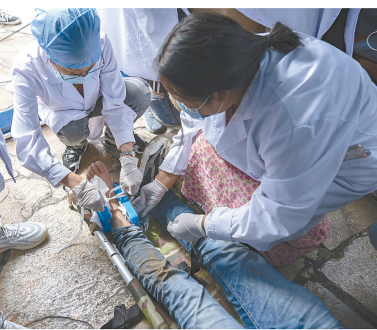
9月6日,在四川甘孜州泸定县磨西镇海螺沟广场受灾群众临时安置点,医护人员为伤员包扎。