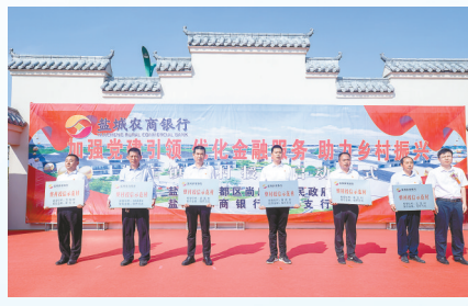
金融服务助力乡村振兴

下一阶段,盐城农商银行将提高政治站位,积极履行地方法人银行使命,坚持服务于疫情防控大局,坚持支农支小,践行乡村振兴,主动加强与各类经济主体和广大市民的对接服务,强化责任担当,积极主动作为。