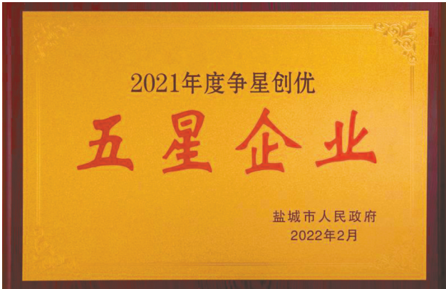
争星创优取得成效

截至8月末,该行各项贷款余额342.04亿元,较年初增加35.64亿元,增幅11.63%。实体贷款余额268.42亿元,较年初增加26.5亿元,其中:普惠贷款余额77.89亿元、消费贷款余额75.64亿元、公司贷款余额114.89亿元。贷款客户数合计37680户,较年初增加1825户。其中,普惠金融17385户;消费金融20295户,较年初增加1704户。