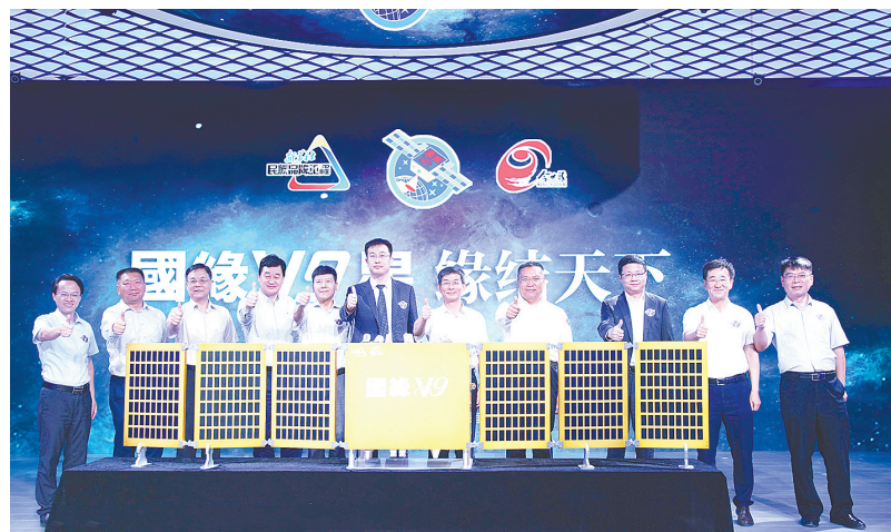
“国缘V9”号卫星冠名仪式在新华媒体创意工场举行