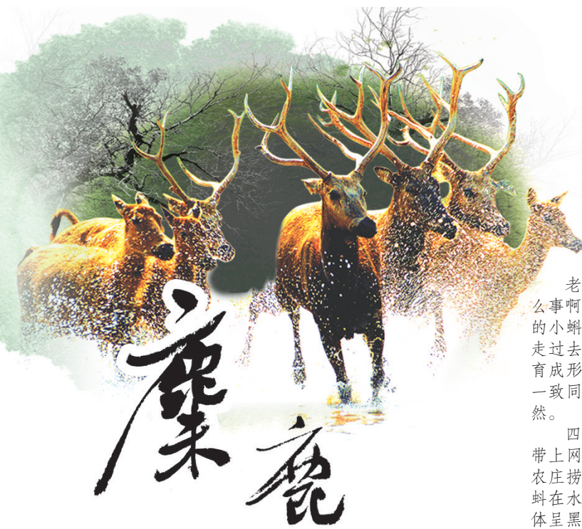
题字:赵守阳