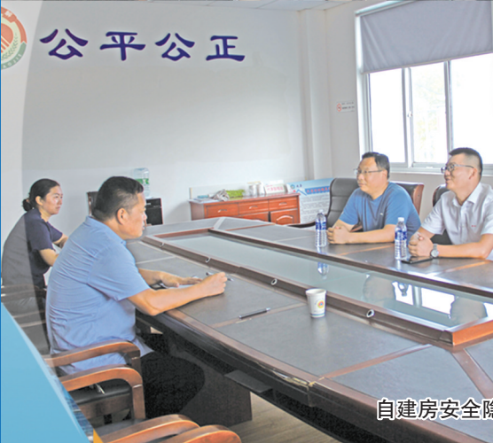
自建房安全隐患排查整治工作座谈会