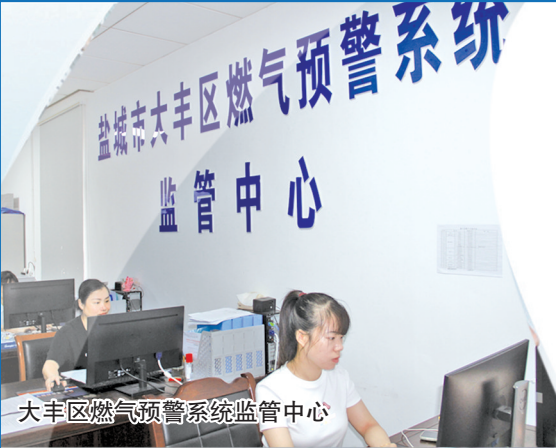
大丰区燃气预警系统监管中心