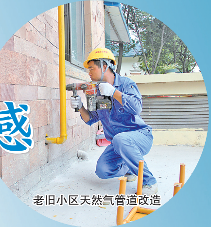
老旧小区天然气管道改造

大丰区全力排查整治全区小区车库、地下室、群租房违规使用燃气的隐患问题,进一步查清底数,列出清单,扎实整改,全面有效消除住宅小区安全风险隐患,建立燃气安全管理长效机制。聚焦城镇燃气重大风险隐患和薄弱环节,会同第三方机构组织开展燃气安全督查检