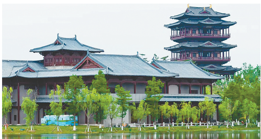
清凉大洋湾