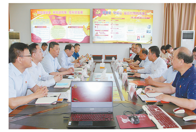
市财政局开展“庆七一”党建联盟实境教育活动

6月中下旬,市财政局联合江苏黄海金控集团赴盐城市射阳河闸管理所开展“庆七一”党建联盟实境教育活动,深入推进“红色温馨,党建联盟”建设工作,推动党建基础教育走深走实、入脑入心。近40名党务工作者通过参观射阳河闸工程、闸史陈列馆、廉政文化室、党支部书记工作室、党建工作室,听取河闸负责人“潮汐相守,矢志向红”党建工作情况介绍,观看射阳河闸国家级创建宣传片《大闸如城》,了解射阳河闸管理所“守潮人之家”党建品牌,让党务工作者在实境学习中接受精神洗礼、汲取红色智慧、凝聚奋进力量。活动现场邀请市委市级机关工委专家讲授《做好新时代党支部工作》专题党课,深入探讨如何将党建与业务工作深度融合、相互促进,不断提升市财政局党务工作者的履职能力和党建工作质量。市财政局和黄海金控集团的党务工作者纷纷表示,要认真学习消化射阳河闸基层党建可复制、可推广的先进做法,让实实在在的党建工程在盐城财政、黄海金控集团基层党组织中不断巩固发展。