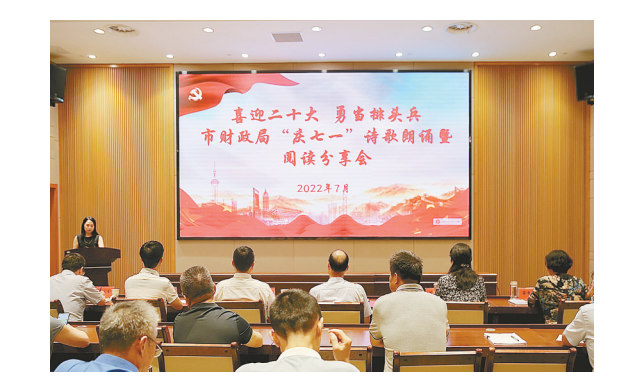
市财政局举办“庆七一”诗歌朗诵暨阅读分享会

7月中旬,市财政局举办“庆七一”诗歌朗诵暨阅读分享会,喜迎党的二十大、庆祝建党101周年,全面营造尊重知识、崇尚阅读的良好氛围。分享环节,12位财政干部围绕活动主题,积极参与诗歌朗诵和分享读书心得。他们或慷慨激昂,或声情并茂,深情诵读《可爱的中国》《红岩》《故乡》等经典作品,在品读中传播真理力量,在分享中激发拼搏干劲,切实将阅读收获转化为财政人前进的强大动力。近年来,市财政局党委高度重视学习型机关建设,抓牢抓实主题阅读,深化细化机关阅读,全民阅读活动持续深入,书香财政建设有力有效,“爱读书、读好书、善读书”的氛围更加浓厚。去年,在庆祝建党百年之际,市财政局职工分别荣获财政部读书征文一等奖、省财政厅演讲比赛一等奖。今年,市财政局积极创新学习方式,拓展学习途径,推进“阅读财政”建设,坚持利用主题党日,开展阅读一本好书、组织一次专题研讨,让财政干部在阅读和学习中汲取营养、开阔视野、丰富知识、提升素养、增强本领。阅读分享会上,举行了“红色温馨”读书分享志愿服务分队授旗仪式。市委市级机关工委相关负责人向市财政局“阅读财政”分队队员授旗。