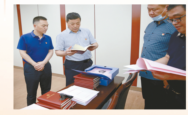
市财政局开展党建基础台账观摩活动

6月底,市财政局开展了“晒台账、亮特色、促提升”党建基础台账观摩活动,全面了解市财政局各党支部今年以来党建工作进展情况,进一步推进党支部基础台账标准化、规范化建设。此次观摩重点围绕“基础台账完整、亮点工作开展、党建工作成效”等,通过现场观摩、查阅台账、聆听讲解、交流分享等方式,详细了解该局各党支部党建工作情况。通过开展此次观摩活动,全局党务干部深入交流,广泛互动,互检互查、互评互学、查找不足、发现亮点,有效激发了财政党员干部钻研业务、比学赶超的工作热情。大家纷纷表示,下一步将结合支部工作实际,学习借鉴好经验、好做法,丰富党建工作载体、规范党建台账建设、提升党建工作水平,推动财政党建工作再上新台阶。