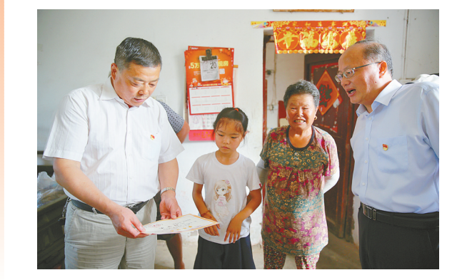
市财政局领导为新荡村困境儿童送上捐款和慰问品

7月上旬,市财政局组织党员干部深入阜宁县芦蒲镇新荡村开展“爱心助学暖童心 党史书籍进乡村”庆“七一”专题活动。此次活动是市财政局机关党委2022年“书记项目”重要内容。活动现场,各支部代表向新荡村困境儿童送去了支部党员干部自发募捐的善款,以及学习用品、牛奶等慰问品,与困境儿童进行沟通交流,详细了解儿童的生活、学习和心理情况,让儿童感受到温暖和关爱,呵护困境儿童健康、快乐成长。市财政局党员干部们听取了新荡村基本情况介绍,参观了该村新建的村泵站、便民公路等基础设施,与村干部共同探讨增加村集体经济经营收入和产业多元发展的思路举措。同时,向新荡村村部党群中心赠送党史书籍及定制的党员学习笔记本等,鼓励该村基层党员干部学党史、学知识,为推进乡村振兴贡献力量。