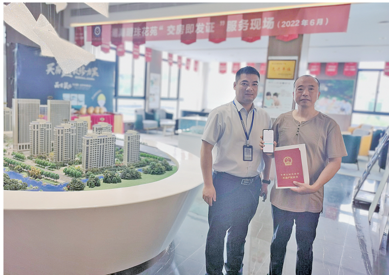
工作人员深入项目现场发证

据悉,盐都区近年来已先后办理企事业单位不动产补充办证手续102宗,土地面积3525亩,房产登记面积64万平方米;化解涉及群众办证难历史问题楼盘8个4500户;化解征迁安置小区不动产登记问题5个,共2370户,群众获得感、幸福感、安全感得到提升。