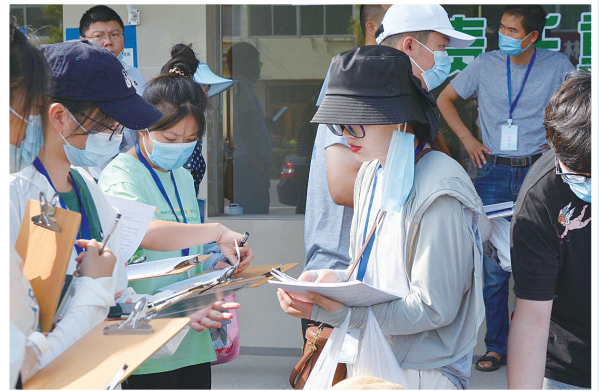
高校大学生开展复查工作

强化宣传引导。 加强政策解读和舆论引导,先后组织自建房排查技术培训和信息平台操作、燃气安全使用知识等各类业务培训,制作《建湖县自建房安全隐患排查》动漫宣传片,发放《建湖县自建房安全专项整治行动宣传问答》等宣传手册,对自建房、燃气安全专项整治工作进行全方位宣传,公布举报电话,引导群众参与到社会安全治理中来,持续为专项整治营造良好的环境。