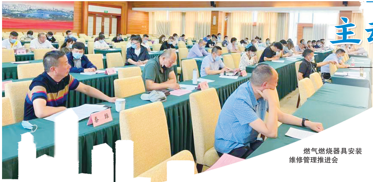
燃气燃烧器具安装维修管理推进会