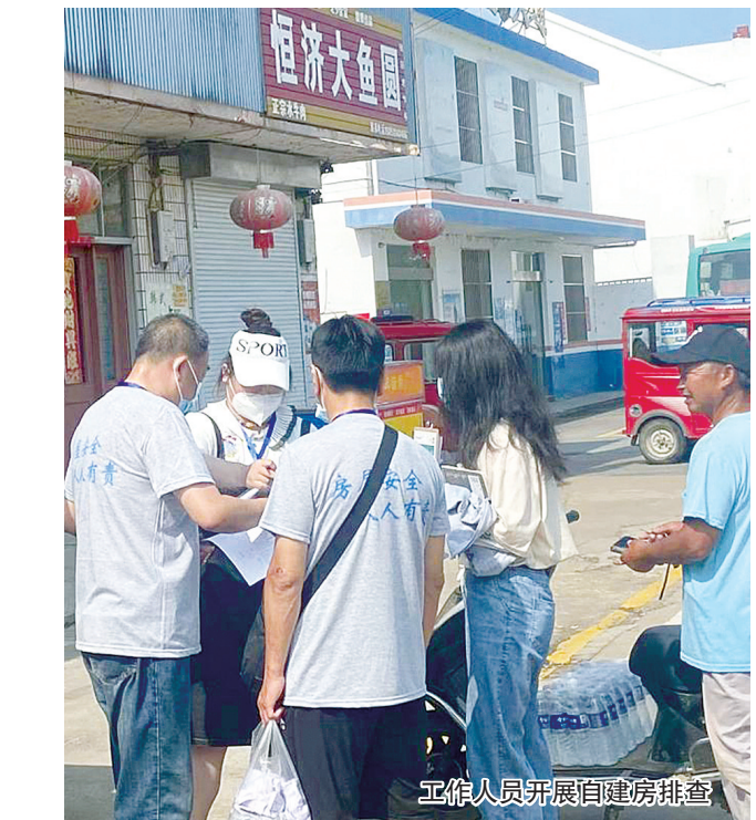
工作人员开展自建房排查