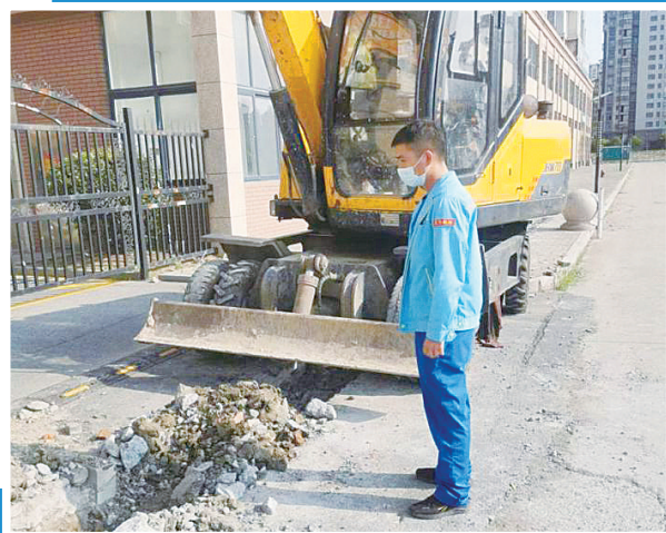
对施工燃气公司进行监护