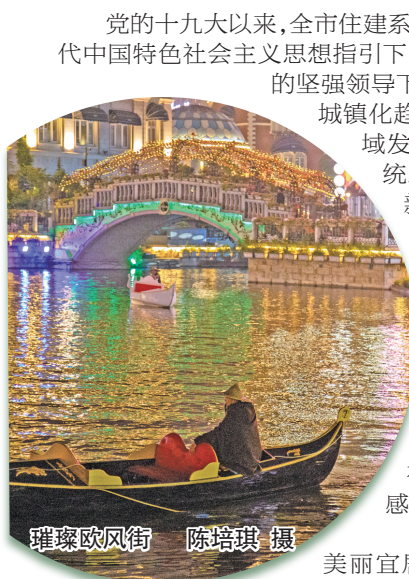
璀璨欧风街