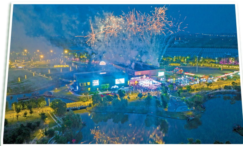
点燃城市“夜经济”