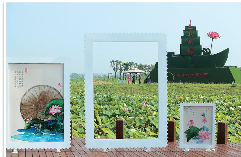
景中人于黄尖牡丹园