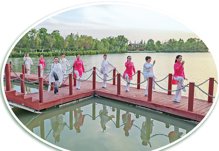
湖畔太极 张罗宝 摄于东台市西溪植物园