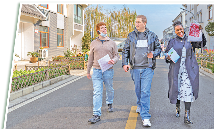
对外友好美名传