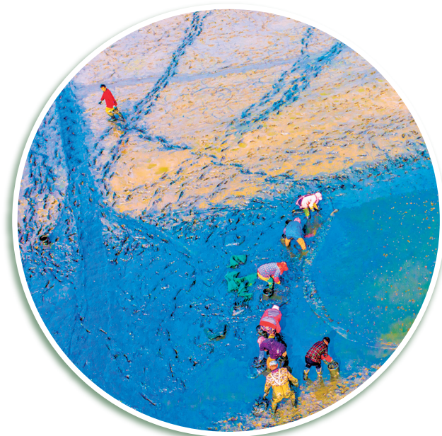
蟹苗丰收于射阳县开发区滨湖大道