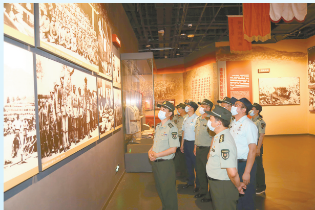
参观新四军纪念馆