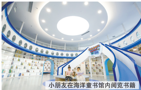
小朋友在海洋童书馆内阅览书籍