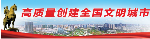
高质量创建全国文明城市

近年来，响水紧紧围绕“千亿级、全链条、集聚式”发展目标，先后招引一批不锈钢系列产业项目。响水形成以德龙集团为龙头的全产业链发展模式，从钢铁冶炼开始，到不锈钢连铸坯坯坏项目，再到不锈钢制品深加工，产业规模越做越大，培育纳税超亿元企业10家、开票过亿元企业100家，市场主体1000家，直接带动就业2万人以上，不锈钢产业产值达2000亿元的“十百千万亿”集聚规模正加快形成。