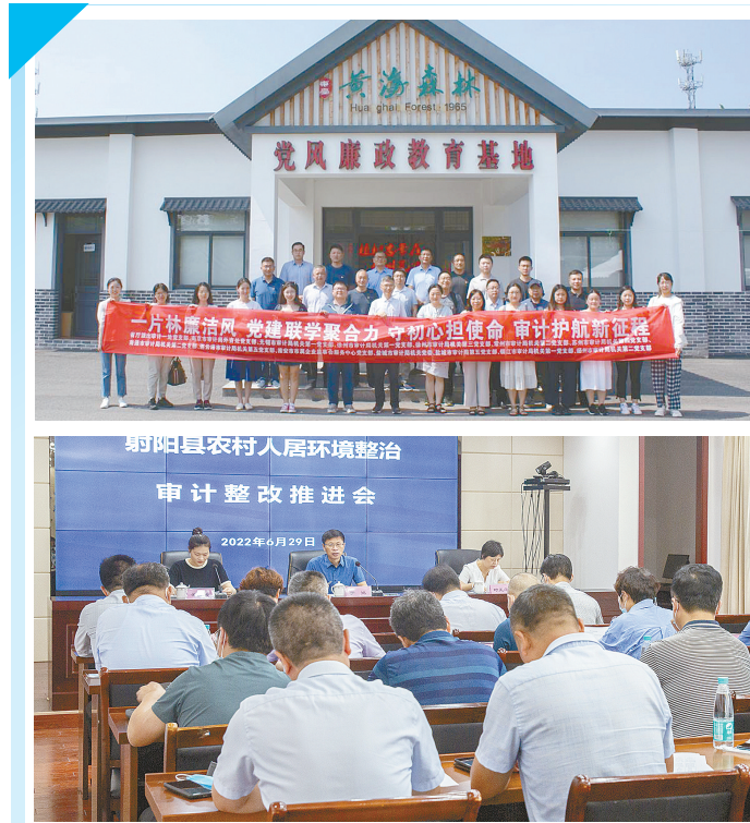
日前,优化营商环境专项审计盐城组与市审计局机关党委及第五党支部联合开展“守初心、担使命”主题党日。

研判矛盾纠纷等级、根源、走向等,对排查出来的风险隐患,抓紧抓实,逐条分析,逐项拿出治理措施,逐个消除化解,做到对账销号。