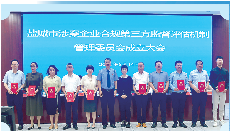
为10位专业人员代表颁发聘书。

“第三方监管人有自身的专业优势,能够从不同角度参与监督评估工作,增强了合规考察的专业性。”市检察院向社会公开征集第三方机制专业人员,突出知识产权、海关缉私、安全生产、环境保护、国有资产保护等重点领域,已建成涵盖律师、会计师、审计师、专家学者等131名专业人员在内的第三方机制名录库。随着第三方监督评估机制的逐步完善,我市企业合规试点通过联动社会各界资源,从检察机关一家独奏,发展成为多方合力、一体推进的工作格局。