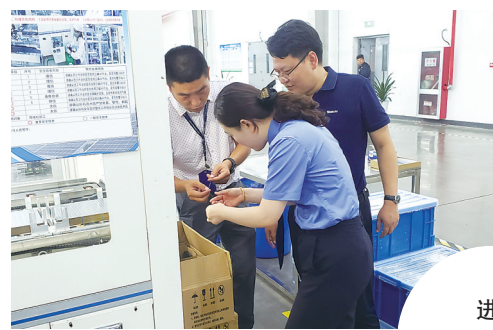
进企业开展实地监督考察。