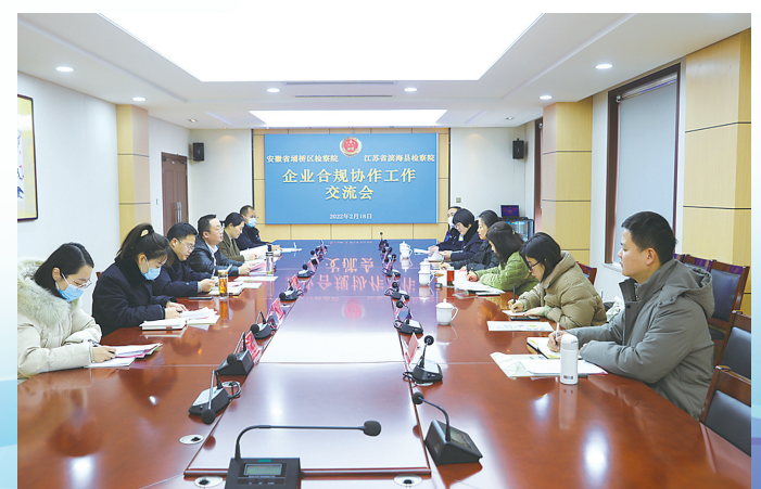
与外地检察机关开展企业合规异地协作。