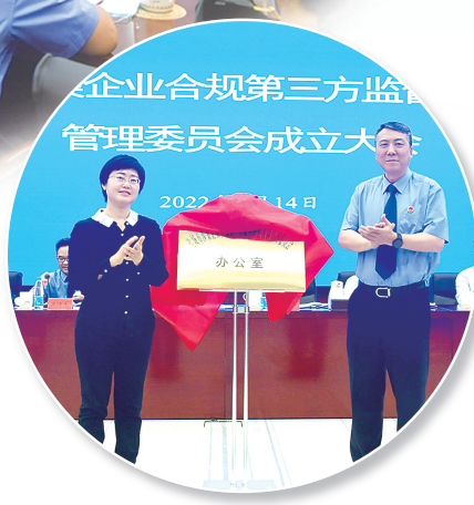
盐城市涉案企业合规第三方监督评估机制管理委员会办公室揭牌。

编者按:市检察院党组书记、检察长葛冰在盐城市涉案企业合规第三方监督评估机制管理委员会成立大会上表示:推进企业合规改革,是深入贯彻落实习近平总书记“法治是最好的营商环境”和“在合法合规中提高企业竞争能力”重要指示精神的务实举措,对增强市场主体信心、稳定企业发展预期,助力经济社会高质量发展具有重要作用。