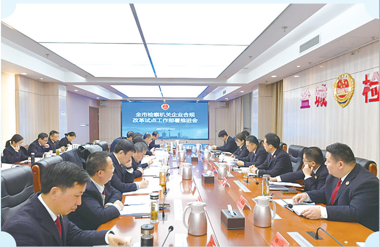
全市检察机关企业合规改革试点工作部署推进会现场。