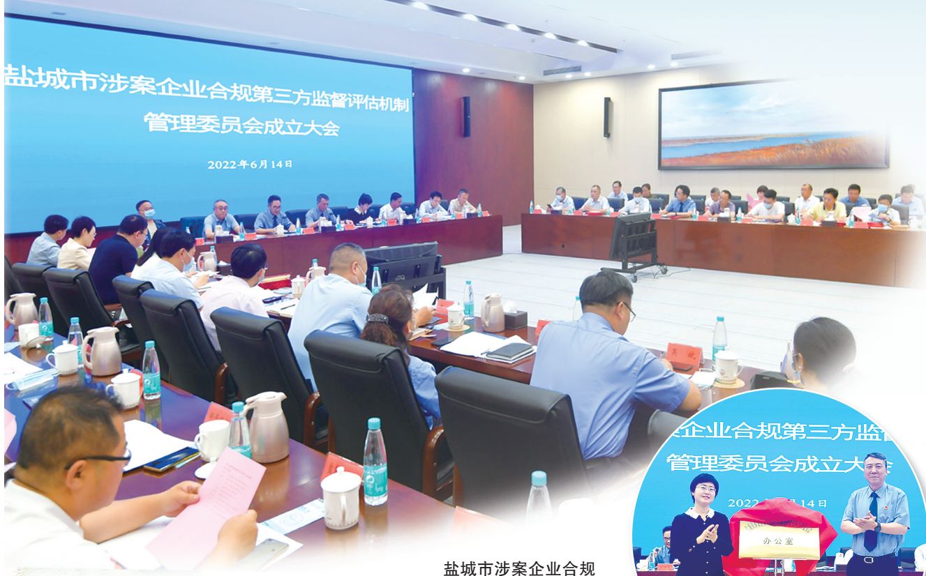
盐城市涉案企业合规第三方监督评估机制管理委员会成立大会现场。