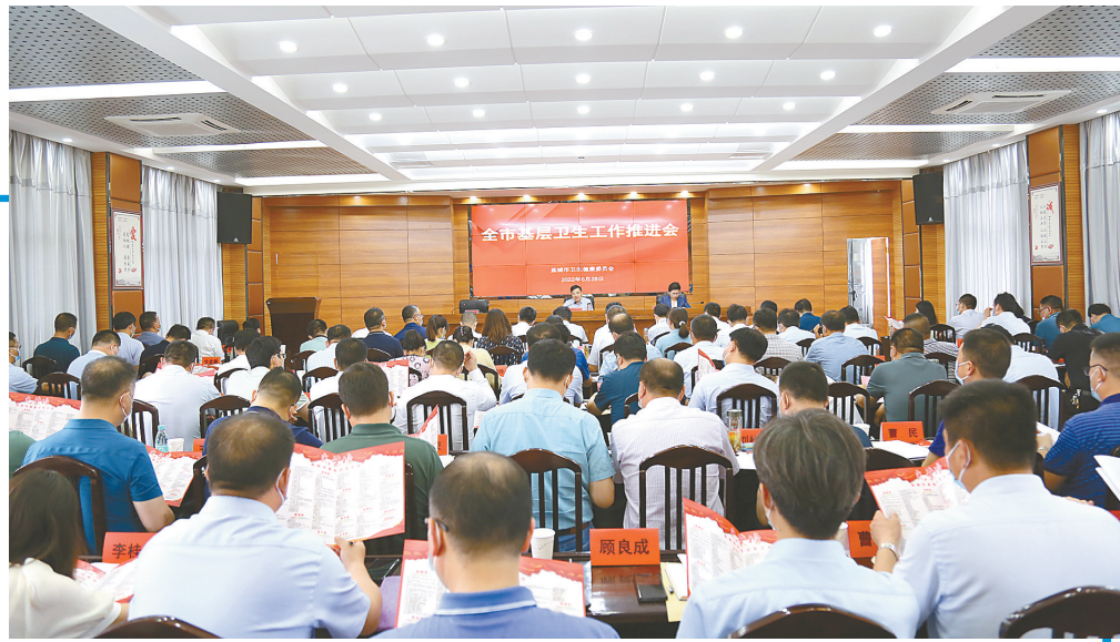
全市基层卫生工作推进现场。

“2022年全国基层卫生健康工作会议强调,要持续推进基层医疗卫生体系改革发展,抓好家庭医生签约和基本公共卫生服务。省委、省政府将基层卫生重点工作纳入民生实事项目管理,将紧密型县域医共体建设、优质服