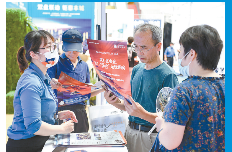
市民听取介绍打探市场行情