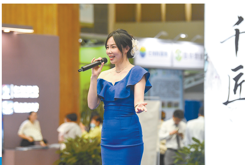
文艺工作者为博览会现场助兴