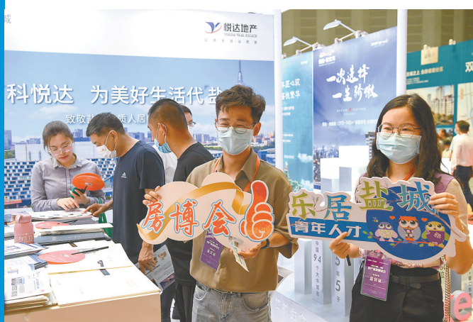
在盐工作和生活的青年人才逛房产家居博览会