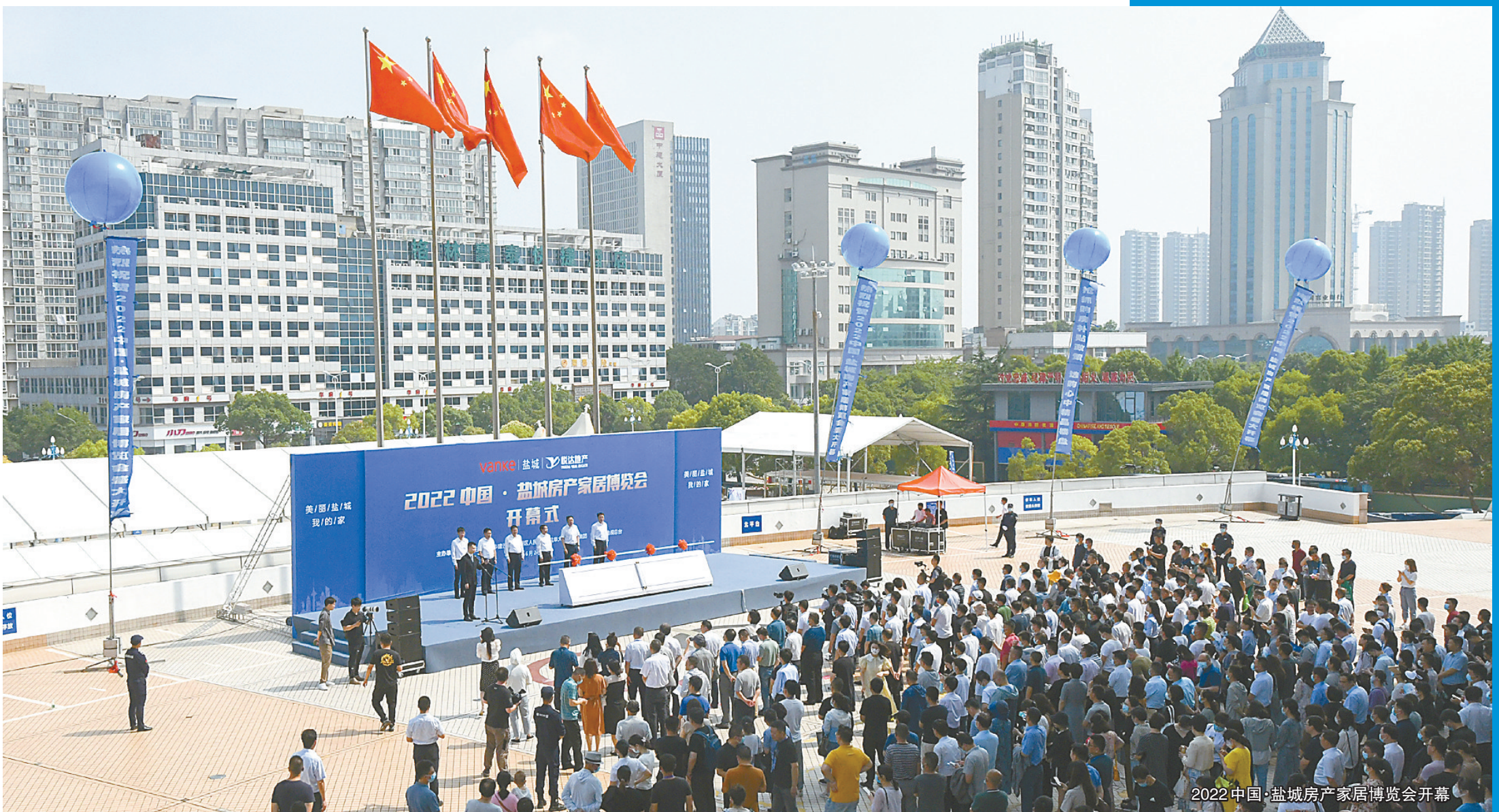
2022中国·盐城房产家居博览会开幕