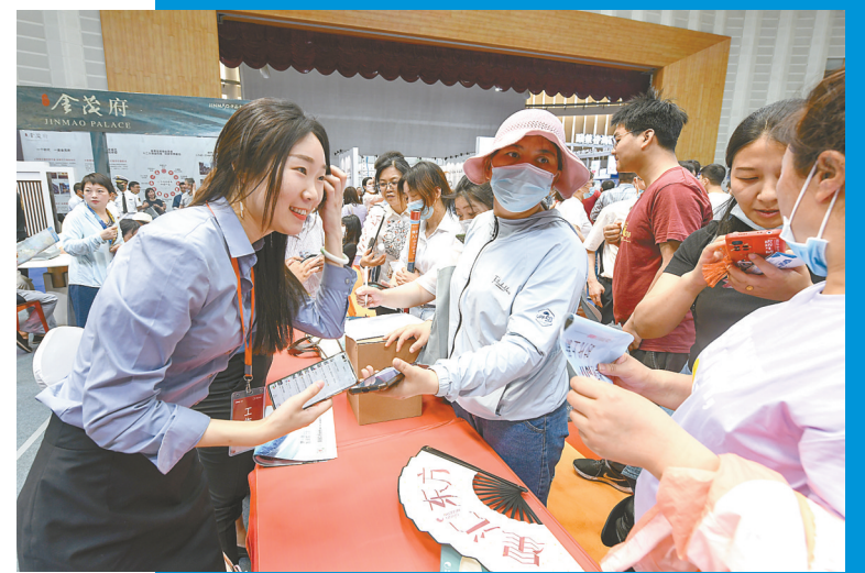
工作人员为市民介绍购房优惠政策