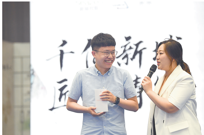
抽奖环节奖励参加活动的市民