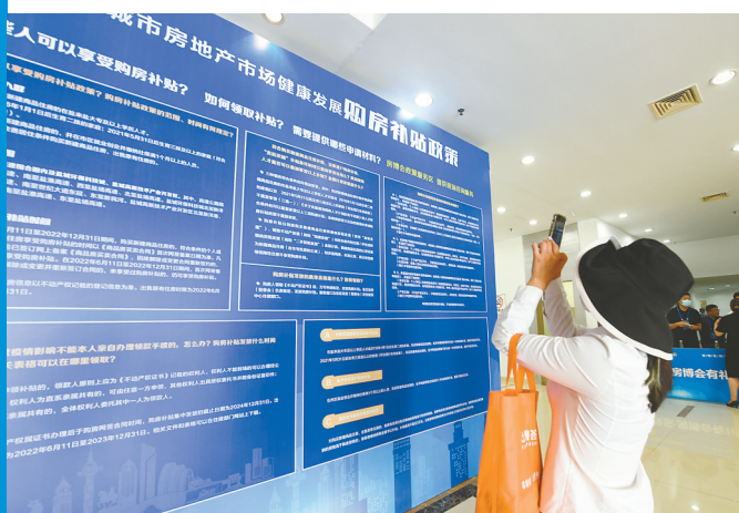
市民认真了解惠民房产政策