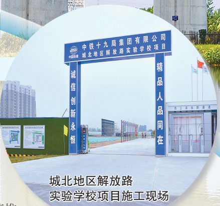
城北地区解放路实验学校项目施工现场

亭湖区城北片区综合开发建设水环境整治项目,计划通过打通断头河、河道拓宽、清淤疏浚、控源截污、岸坡绿化、景观打造等措施,对城北片区北环路以北、范公路—开放大道以西范围内69条河道按照城市景观河道标准进行整治,计划总投资约16.5亿元,由盐城城北开发建设投资有限公司负责实施。