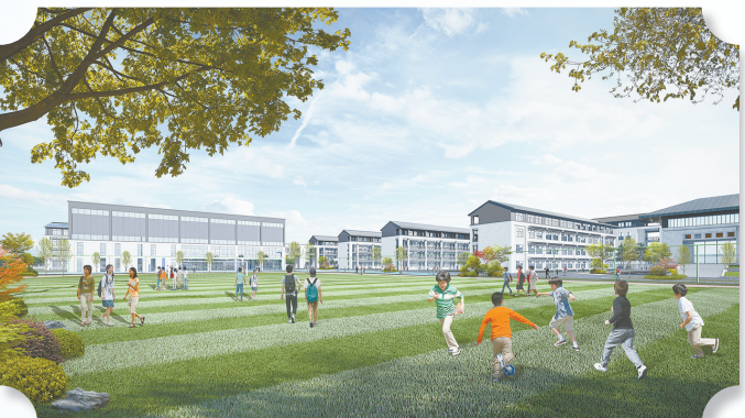
城北地区解放路实验学校北校区(景山中学北校区)效果图

景山中学北校区位于解放路实验学校北校区东侧,两个学校分开施工、同步建设,均计划于2023年秋季学期招生。