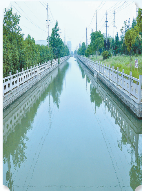
整治后的城北伏西河

城北老旧小区改造项目有二纺厂家属区、麦芽厂家属区、农民公寓、新日月翠洲嘉园小区等,总建筑面积为51.5万平方米,涉及4430户。