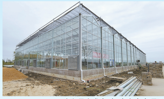
建湖县九龙鱼肆、水乡农庄项目