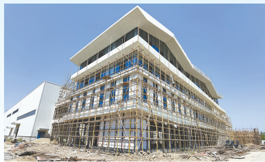
阜宁县江苏中江种业智慧农业示范园种子仓储项目