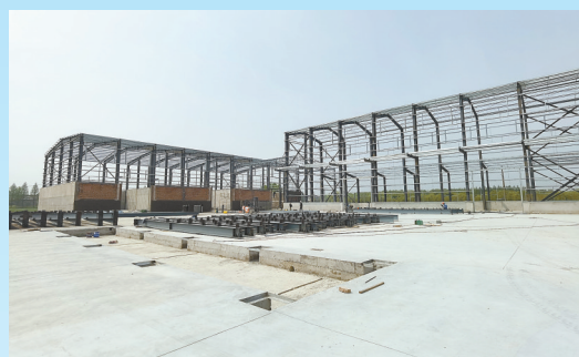
亭湖区正洋优质稻米基地项目