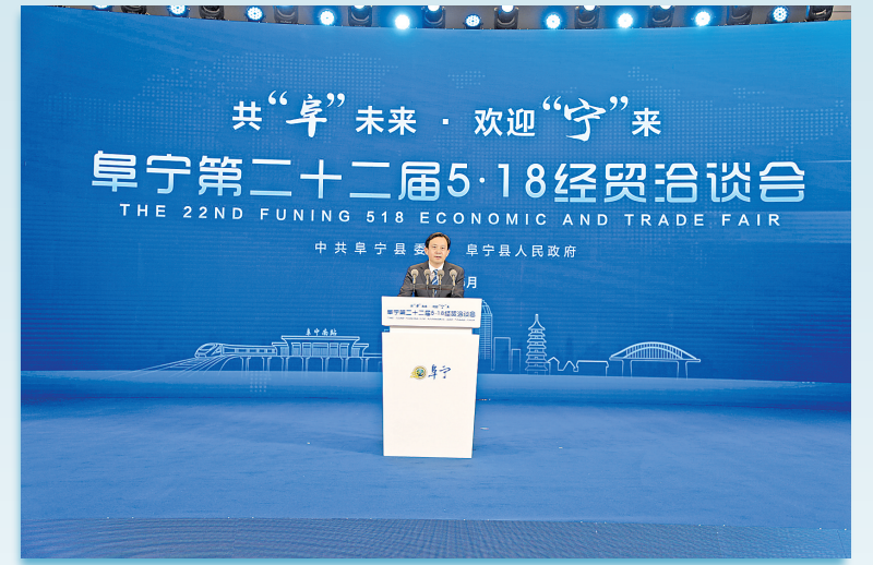
第22届“5·18”经贸洽谈会开幕式现场