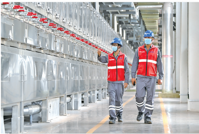
赛得利(盐城)纤维生产场景

赛得利(盐城)纤维有限公司是“5·18”集中签约落地的项目。早在2021年上半年,新加坡金鹰赛得利集团和澳洋集团项目合作签约仪式已在盐城举行。