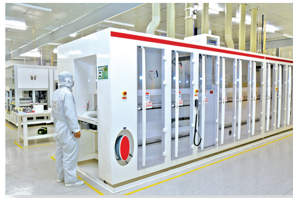
苏民绿色能源科技

熠辉金属项目总投资5.3亿元,于今年1月份开工建设,预计8月份一期建成运行。项目计划建设44条全自动生产线,涉及电子电镀、塑料电镀、阳极氧化、电泳等各类表面处理领域。项目竣工达产后,将进一步推进表面处理行业健康可持续发展。项目运营投产后,可形成年出工件518.32万平方米的生产能力,年销售约6亿元,实现税收约7500万元。