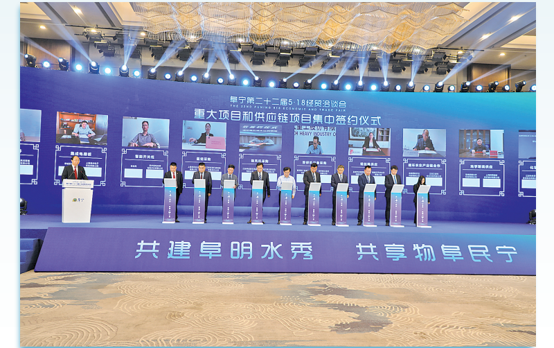
重大项目和供应链项目“云签约”