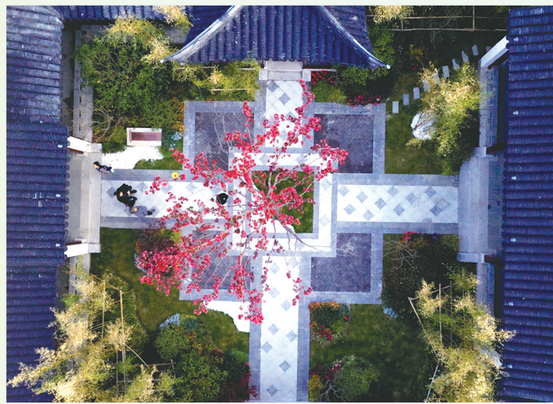
海棠书院

颁奖时间：2022年5月30日—6月3日 联系人：冯女士，电话15995189741