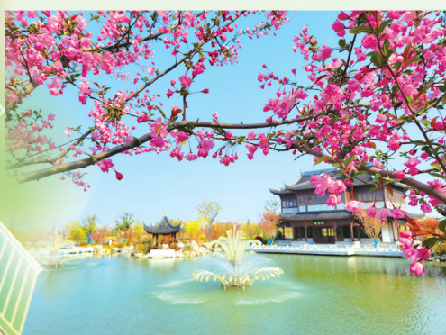
海棠春色