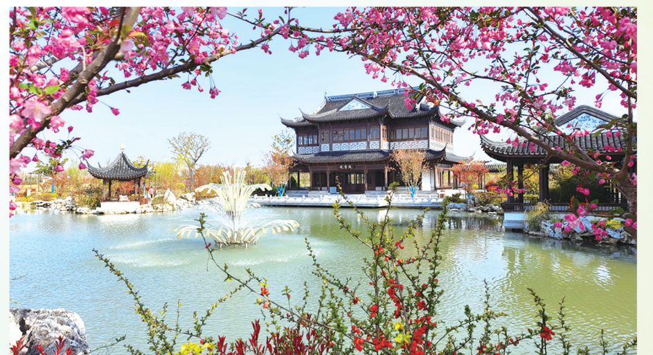
水榭楼阁