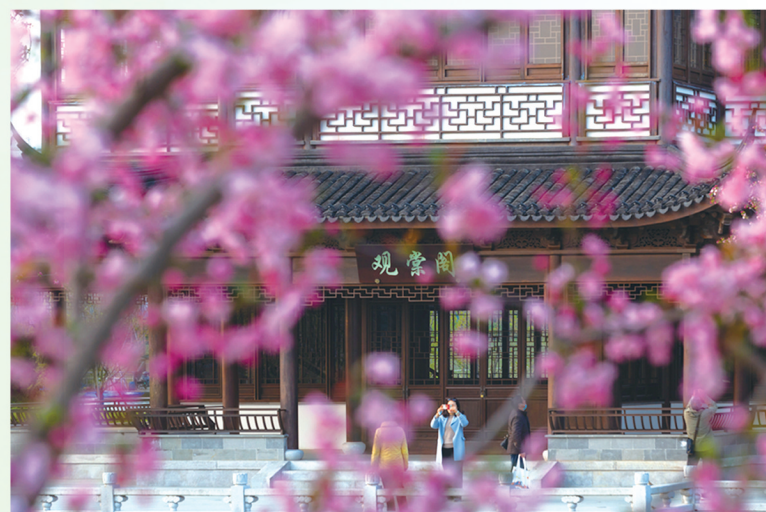
花海观棠