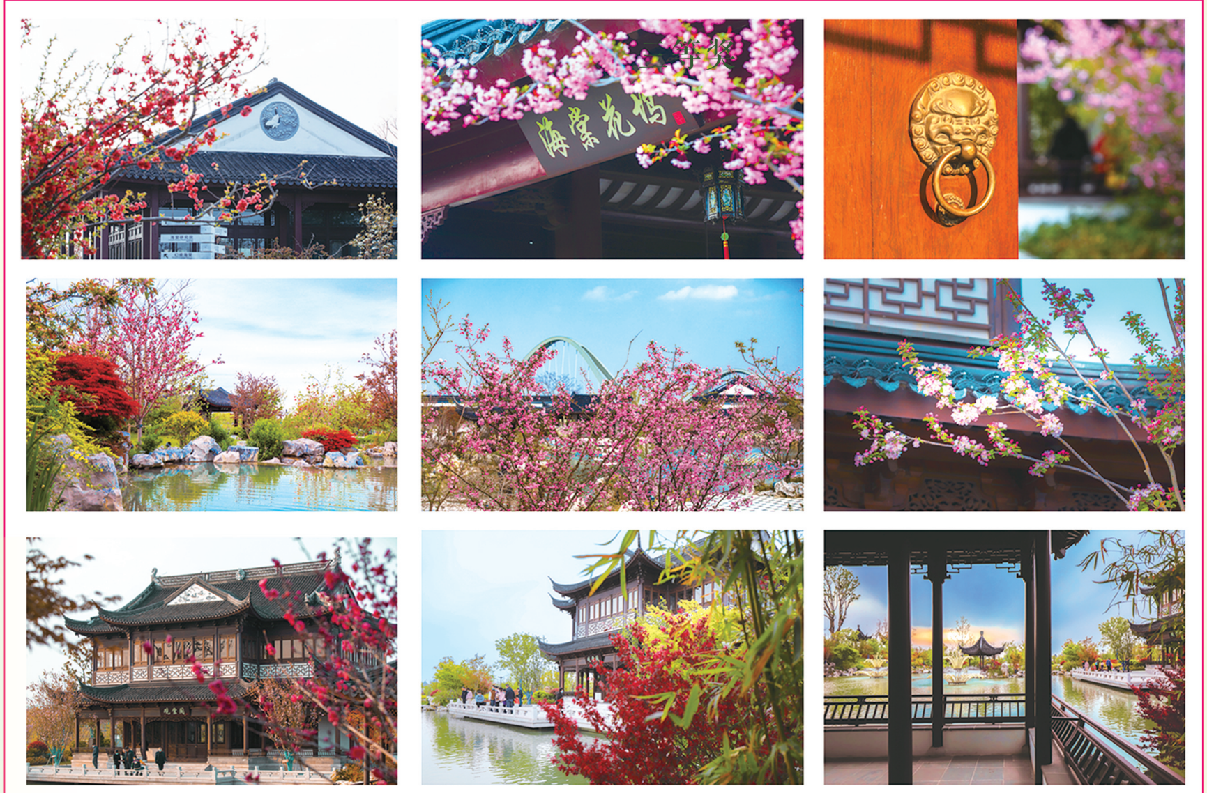
一步一景（组图）