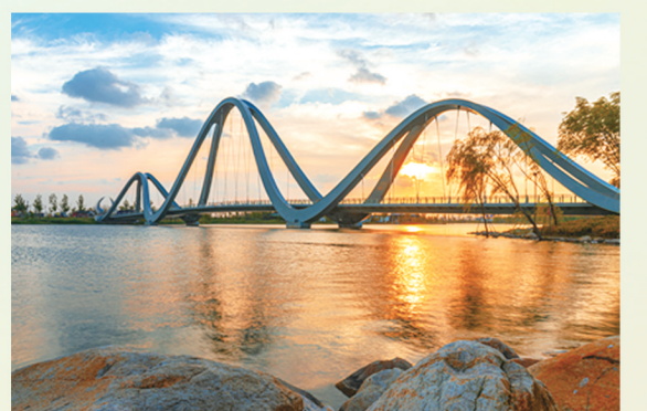
龙桥晨曦

主办单位： 盐城市盐南文旅发展有限公司 中华海棠园 承办单位： 盐阜大众报业集团