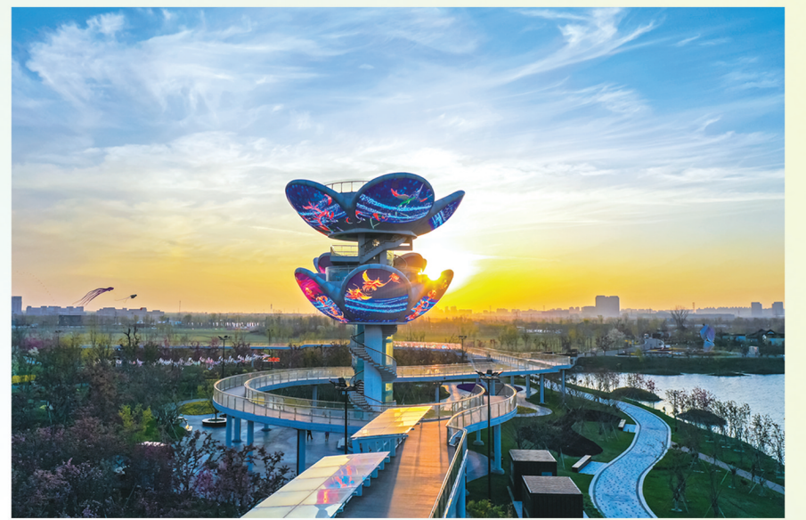
海棠花季映余晖