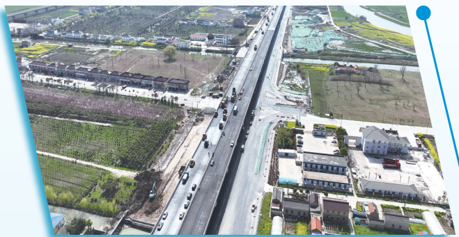
盐丰快速通道(一期)