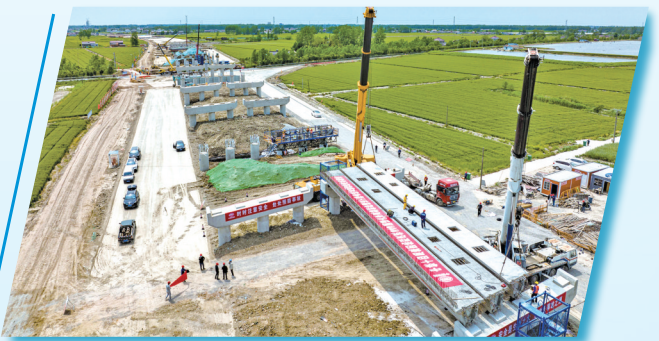
盐丰快速通道(二期)