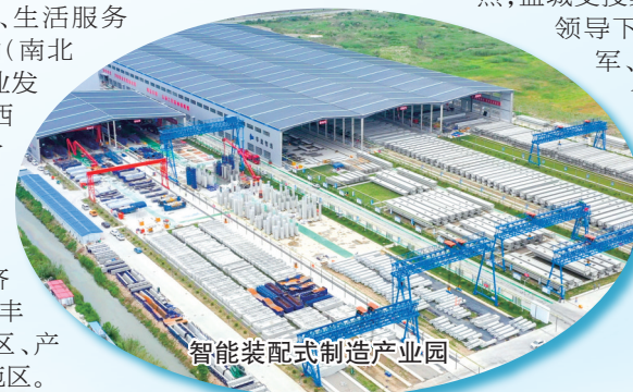
智能装配式制造产业园

集团深耕长三角一体化产业发展基地,围绕“智造之核”的发展定位,高起点规划建设常盐工业园拓展区,突出生活型配套和生产型配套两大板块,涵盖智能装备制造、创新研发、社区服务、商业配套、金融服务、人才公寓等,与园区的已建成区形成“一主(智能制造中心)两副(生产服务中心、生活服务中心)双轴(南北先进制造业发展轴、东西产城融合发展轴)”的总体空间布局,打造飞地经济展示区、盐丰一体引领区、产城融合示范区。