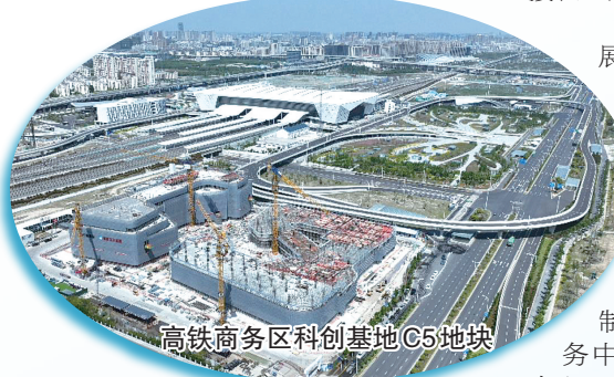
高铁商务区科创基地C5地块

业厚度和经济密度,打造产业空间通达、产业生态聚合、产业服务集成、产业环境融通的现代化产业经济综合体,成为接轨上海、融入上海的开放平台,承接长三角产业转移的前沿阵地。