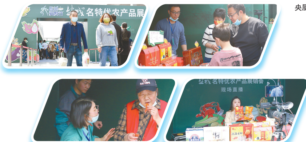
“盐之有味”盐城名特优农产品展销会