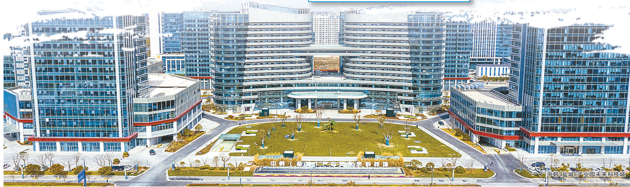
中韩(盐城)产业园未来科技城

三产服务业方面。东投酒店、东拓会展等10多个三产服务业项目,在填补全区产业空白的时候,集团自身也加快市场化步伐。