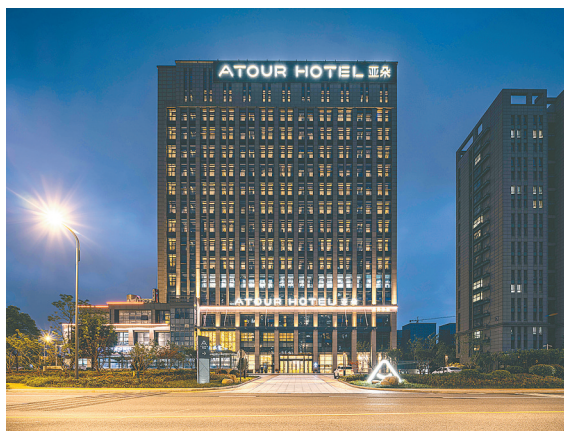
集团打造的三产服务业项目