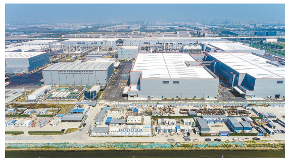
承建的SK30GWh动力电池项目施工现场