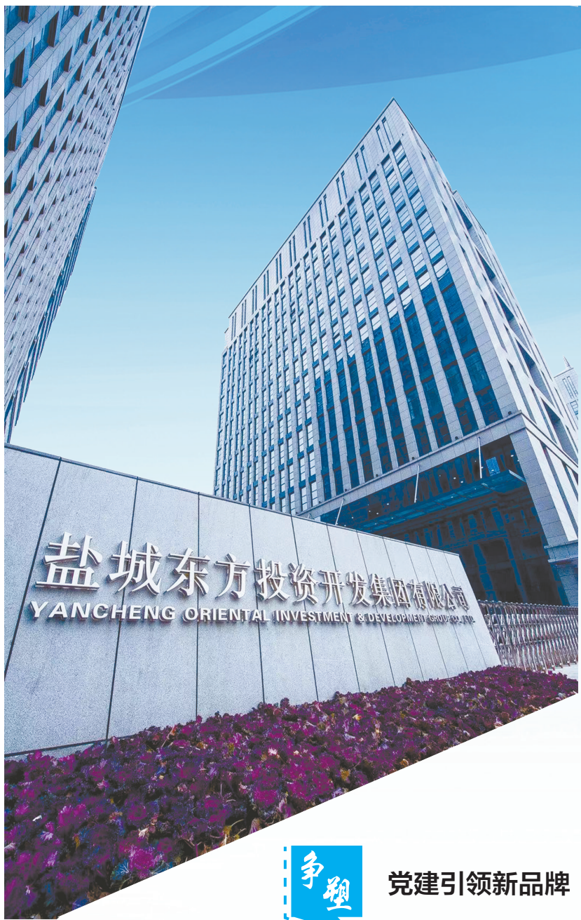
盐城东方投资开发集团有限公司 YANCHENG ORIENTAL INVESTMENT & DEVELOPMENT GROUP CO., LTD.