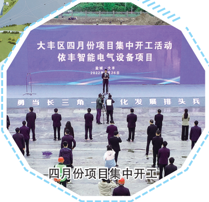
四月份项目集中开工

推动长三角一体化发展,是习近平总书记亲自谋划部署的重大战略决策,具有重要的政治意义、时代意义和实践意义。长三角一体化产业发展是大丰借梯登高的重大机遇。当前,全区上下紧扣“一体化”和“高质量”两个关键词,全面擂响高质量建设产业基地的铮铮战鼓,着力构建互联互通、共建共享新格局,铺展大丰高质量发展的“新画卷”。