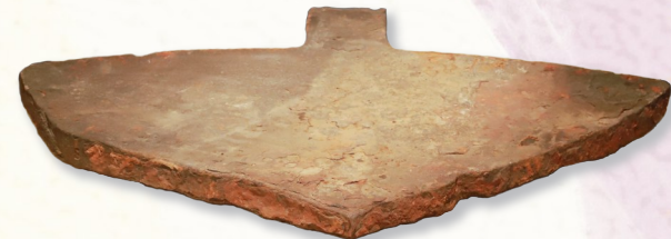
宋元切块盘铁(市博物馆藏品)

盐城东临黄海,以其独特的地理位置与“盐”相依共存,并结下数千年的不解之缘,某种意义上说,盐城的历史,就是一部盐业发展史、一部东方盐文化史。保护好城市中的历史文化遗产,成了经济建设发展过程中的必然选择。如何让文物保护工作与现代城市建设相融合,是赵永正一直思考的问题。“历史是最好的教科书,考古遗存等历史文化遗产是注解城市发展最好的‘活字典’。”赵永正说,他们将挖掘文物所蕴含的时代价值,不断加强文物遗址考古研究,讲好文物背后的故事,让盐城历史文化的内涵更丰富、意义更深远、影响更广泛。