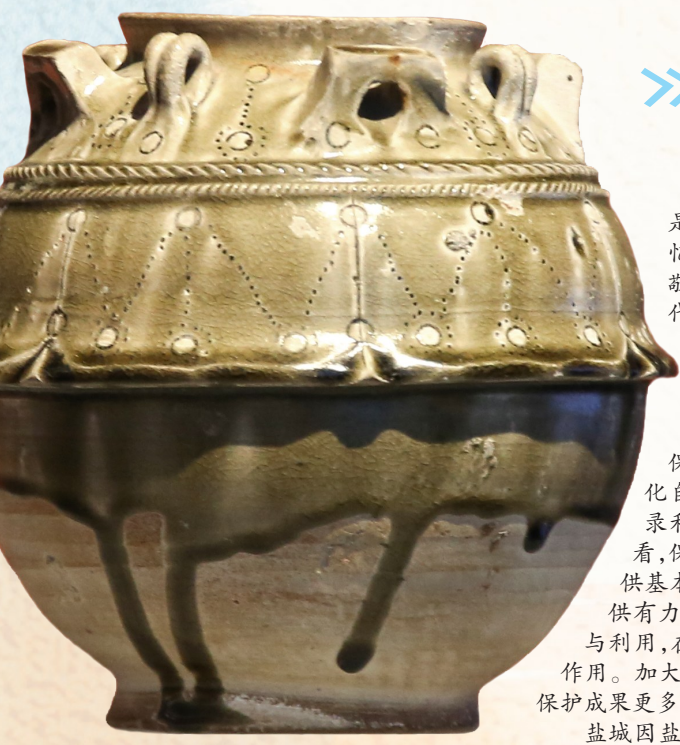
隋代连瓣纹八系罐(市博物馆藏品)

一座城市的历史遗迹、文化古迹、人文底蕴,是城市生命的一部分,蕴含着丰富的历史文化记忆。习近平总书记指出,要敬畏历史、敬畏文化、敬畏生态,全面保护好历史文化遗产。市八次党代会也提出要“以珍爱之心、尊崇之心保护好传统风貌、历史肌理,打造有影响力、感召力的城市文化名片,留住远去的乡愁,唤醒过去的记忆”。