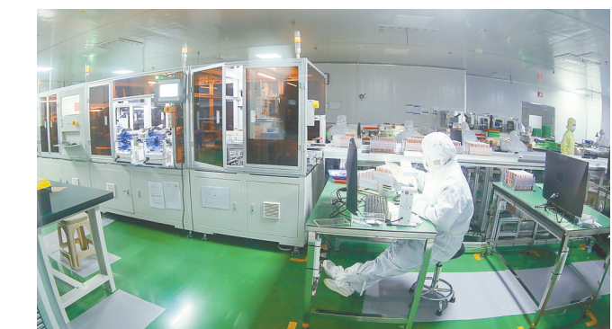
东台高新区富乐华功率半导体研究院专注功率半导体行业基础材料的研发，与富乐华半导体公司形成上下游产业链配套，助力富乐华集团打造集成电路产业链“链主”企业。

确要求，对推动政协工作高质量发展具有很强的指导性和针对性，全市政协系统和广大委员要认真学习贯彻，奋发有为开创政协工作新局面。陈红红要求，要围绕“凝心聚力”做好政协工作，坚持党对政协工作的全面领导，落实市委最新要求，紧紧围绕市委决策部署谋划推进政协重点工作，（下转8版）