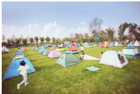
五一小长假,恰逢大洋湾第五届帐篷节,每天都有游客带着装备来大洋湾享受露营的乐趣。搭起帐篷,铺好野餐垫,既能呼吸新鲜空气,又能体验大自然的清新和乐趣,非常适合全家一起出游。