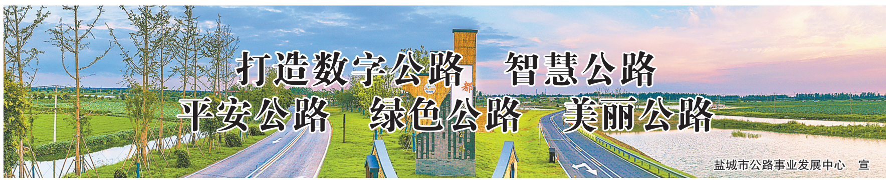
盐城市公路事业发展中心 宣