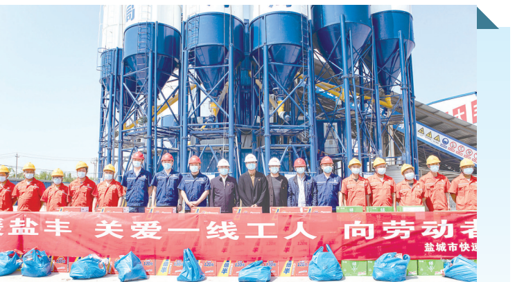
5月3日,市交投集团快速路网建设有限公司会同盐丰快速通道二期工程三标段项目经理部,在该标“三集中”场地慰问节日期间坚守岗位的一线施工人员。