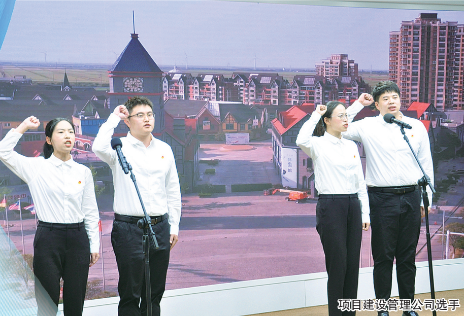
项目建设管理公司选手

开幕式结束后,“党旗飘扬盐城港”“强港有我青年说”主题演讲比赛决赛举行。从盐城港码头的一线守门人,到中帼风采的“海燕”班组,再到与疫情战斗的酒店最美逆行者,盐城港引航站的拓荒人邹建国……18组参赛选手紧扣主题,结合自身感悟感想,配以精心制作的PPT、视频、图片和音乐等,生动讲述了一个个红色故事、奋斗故事,热情讴歌了百年以来中国共产党为中国人民谋幸福、为中华民族谋复兴的丰功伟绩,展现了盐城港集团发展的丰硕成果,分享了党史学习教育的感悟和个人成长的收获。 致敬青春,砥砺前行。选手们饱满的激情,昂扬的文字,铿锵的语言,无不抒发了青春年华的梦想与希冀,展现了盐城港人积极奋进、砥砺前行的智慧与力量。比赛以习近平新时代中国特色社会主义思想为指导,结合集团先后举行的“百团大战”“向邹建国同志学习”等活动内容,着力体现集团基层党组织战斗堡垒作用和党员先锋模范作用,通过平凡而质朴的事迹,讲好盐城港故事、弘扬码头正能量,营造了“举旗帜、聚民心、兴文化、展形象”的良好氛围,着力构建“强港文化”,为盐城港集团高质量发展凝聚不竭动力。