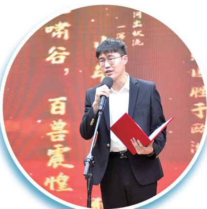
国际陆港集团选手

2020年6月16日,市委市政府审时度势,整合盐城海港、内河港,盐城港集团应运而生,“握指成拳”让千年盐城实现了强港梦想。2021年,盐城港首次进入全国亿吨大港行列,货物吞吐量、集装箱增幅均列全国沿海54个港口第二位。今年一季度完成货物吞吐量3185.7万吨,同比增长85.3%,完成集装箱量13.65万TEU,同比增长91.33%,增幅分别位列全国沿海港口第一位和第二位,圆满实现了首季“开门红”。