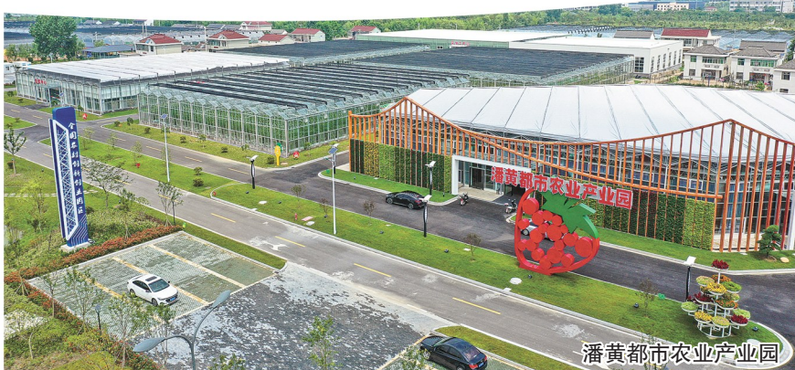
潘黄都市农业产业园