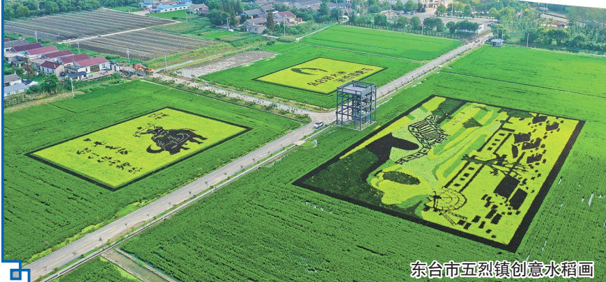
东台市五烈镇创意水稻画