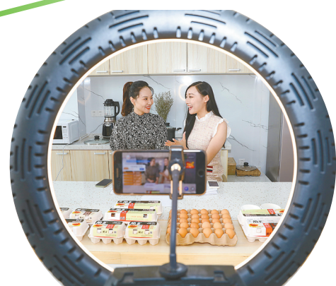
使用智慧农业平台,推广线上销售