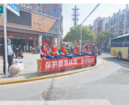
4月22日是第53个“世界地球日”。亭湖区便仓镇以“珍爱美丽地球,守护自然资源”和“践行绿色生活,守护美丽家园”为主题开展绿色环保宣传,向群众发放宣传单和主题环保袋,普及环保知识,进一步提升居民的环保理念,使“保护环境、珍惜资源、保护地球、人人有责”的理念深入人心,取得了良好的效果。