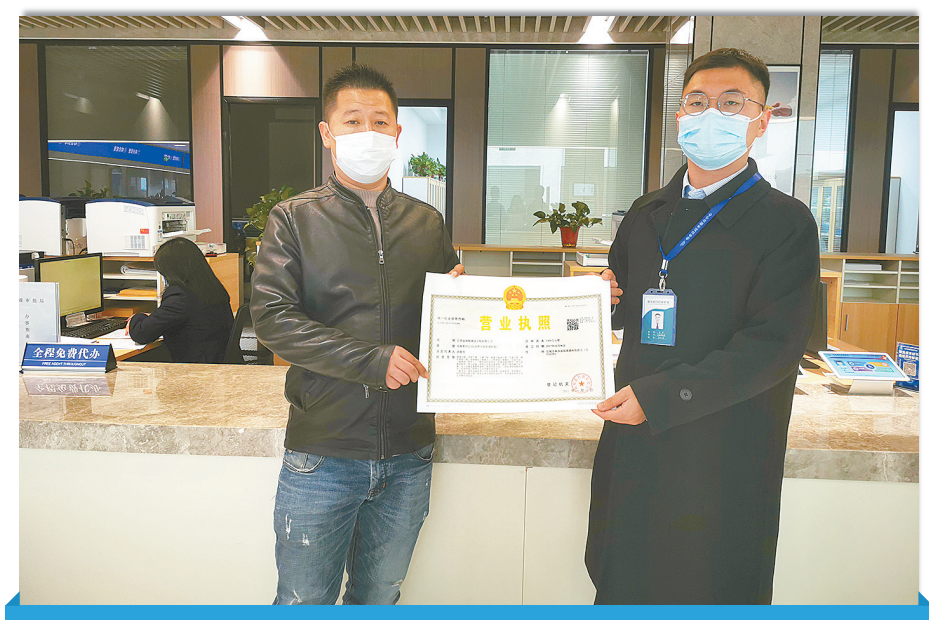
强服务创新,依托信息化方式,积极拓展企业登记全程电子化覆盖面,努力实现企业登记“全流程、无纸化、零见面”,提高群众

为了让企业“少跑腿”“不跑腿”,群众“好办事”“快办事”,响水县行政审批局积极推进企业变更登记全程电子化,持续推出全程网办、远程指导、双向邮递、帮办代办等服务,有效减少办事人员的聚集,节约办事成本,提高办事效率。响水县行政审批局将积极围绕提升企业办事便利度,持续加