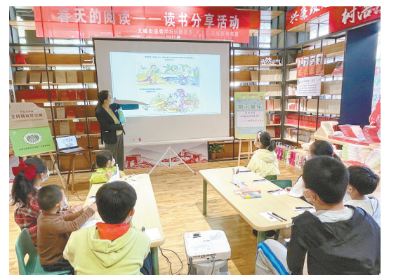
为丰富辖区青少年生活,4月23日,亭湖区文峰街道儒学社区团总支、关工委携手盐城新华书店围绕“春天的阅读——读书分享活动”主题,开展亲子阅读活动。

4月上旬以来,阜宁县境内晴雨相间,干湿交替,利于小麦病虫害发生。该街道农业办踏田精准测报,确立4月20日至4月24日为防治适期。为方便农户统一治虫,花园街道农业办提前统计各村(居)农户小麦面积,计算用药量,垫资从县农资部门统一购回后,分发给种植户。为加快防治进度,花园街道农业办协调引进21台植保无人机和相关技术人员为种田大户提供有偿服务。广大农户实行无人机、喷雾器相结合的方式,全面防治病虫害。