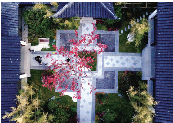
海棠书院

网络投票结束后,主办方综合网络投票结果及专家评审意见评选出“海棠摄影季”一、二、三等奖及优秀奖,获奖作品将在盐阜大众报业集团各媒体平台集中展示,并向“学习强国”等平台推送。